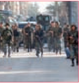
استمرار ردود الفعل الرسمية والنيابية والشعبية المرحة بالخطة الأمنية في طرابلس