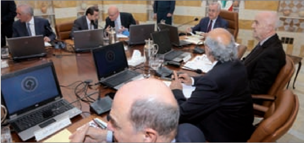
مجلس الوزراء مجتمعاً في بعبدا (الدايتي ونبرا)

في هذا المناخ اللبناني الفارق بالتفاصيل كان العالم يتابع ما نقل عن نية وزير الخارجية الأميركي جون كيري الاستقالة بعد الفشل الذي أصيب به مشروعه للسلام الفلسطيني «الإسرائيلي» ووصوله للطريق المسدود. راهن وزير الخارجية الأميركي جون كيري على ورقته الراجعة في توظيف العوامل الاستثنائية الحاكمة في الشرق الأوسط لدخول التاريخ وتعويز كل الهزائم التي جلبها لإدارته والورقة الراجعة في نجاح المفاوضات الفلسطينية «الإسرائيلية». رهان كيري تأسس على تداعيات متنامية لتطورات المواجهة الحاسمة التي تشهدها المنطقة ومحورها سورية سواء على صفة مصادر القوة «الإسرائيلية» أو تأثيرها في الساحة الفلسطينية للوصول بالطرفين منتهكين مستسلمين للمشيئة الأميركية لتدبير ما يمكن تدبيره للخروج بحل يحفظ ماء الوجه للقيادتين الفلسطينية و«الإسرائيلية».