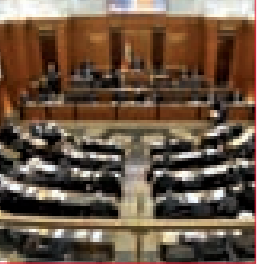
تشريع على طريقة «لا يموت الديب ولا يفنى الغنم»