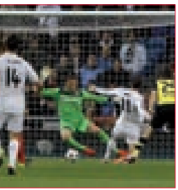
سان جيرمان يتعمق أمام تشيلسي وبلان يضع اللقب نصب عينه