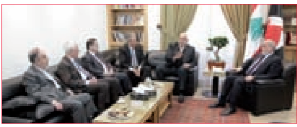
3 حردان يستقبل لجنة التواصل في كتلة التحرير والتنمية