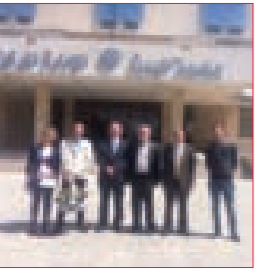
وفد من «القومي» يزور جامعة البعث في حمص