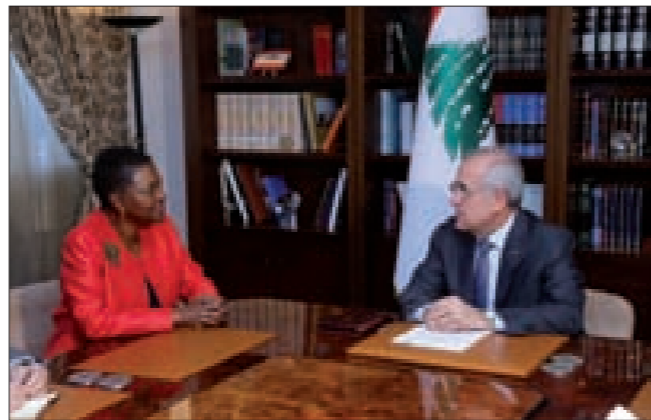
سليمان وأموس في بعثا

رئيس الحكومة تمام سلام وأكد «أن مهمة المجتمع الدولي هي دعم الحكومة اللبنانية والشعب اللبناني والمجتمعات التي تستضيف العديد من النازحين السوريين وتقدم الدعم لهم».