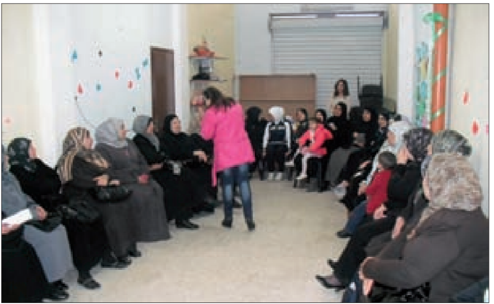
من النشاطات في «أكاديمية المرأة»

الممكن للمشاركة، فقد مُدّت دورات متعدّدة في الأكاديمية، خصوصاً تلك التي شهدت إقبالاً على حضورها أثناء فترة التنفيذ. وضمن أنشطة المشروع الخاصة