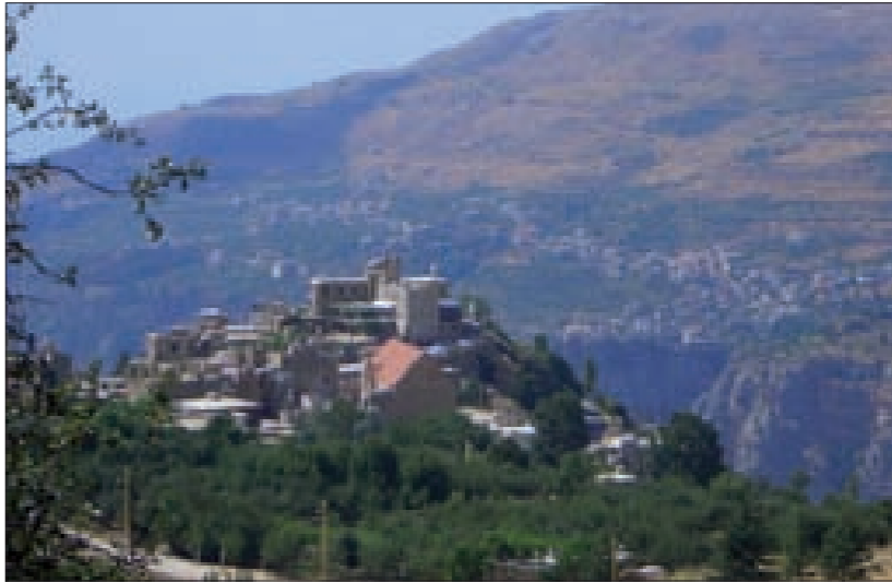
من أحياء البلدة