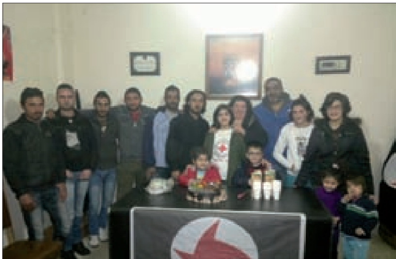
من احتفال حوش بردى

أحيحت منفذية بعلبك في الحزب السوري القومي الاجتماعي عيد مولد باعث النهضة أنطون سعاده، باحتفالات في عدد من الوحدات الحزبية. إذ أقامت مديرية بعلبك احتفالاً في مكتب المنفذية حضره ناظر الإذاعة والإعلام إياد معلوف، مدير المديرية غسان الحاج حسن وأعضاء هيئة المديرية، وجمع من القوميين والمواطنين. تحدث في الاحتفال فادي ياغي، ثم ألقى معلوف كلمة منفيذية بعلبك، تحدث فيها عن معاني المناسية، لافتاً إلى أنّ النهضة السورية القومية الاجتماعية بتعاليمها ومبادئها هي حركة صراع وتقدم، انبثقت لتخليص الأمة من حالات التخبط والفضوى وأتات الطائفية