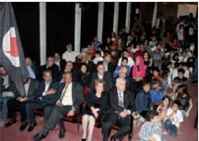
الحضور الحاشد في مسرح بابل في الحمرا