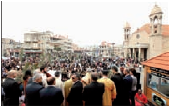
من احتفال ضهور الشوير

احتفلت الطوائف المسيحية في لبنان أمس بأحد الشعانين، فأقيمت القداس في الكنائس وقرعت الأجراس، فيما احتفل الأطفال على طريقتهم الخاصة. وفي ما يلي، عرض لأبرز هذه الاحتفالات.