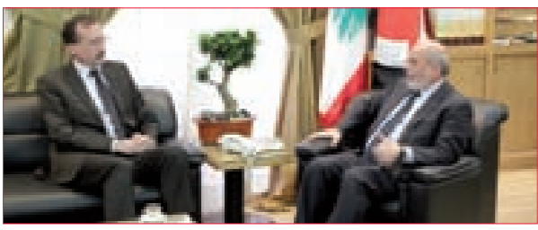
حردان: لقرار سياسي أوروبي حاسم يرفض الاحتلال والاستيطان