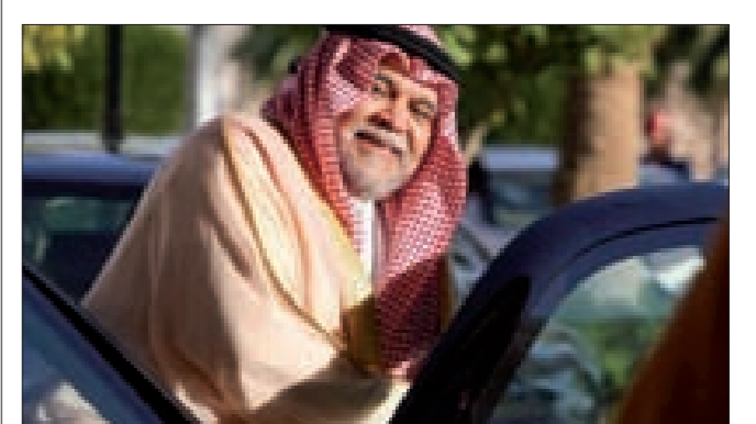
(التتمة ص 10)

صدر في السعودية أمس أمر ملكي بإعفاء الأمير بندر بن سلطان رئيس الاستخبارات العامة من منصبه بناءً «على طلبه». ونقل التلفزيون السعودي أن الأمر الملكي الصادر أمر بتكليف الفريق أول ركن يوسف الإريسي بتسيير مهام جهاز الاستخبارات. ويوزع الملك السعودي عبدالله ضمن هذا البيان الذي أوردته وكالة الأنباء السعودية كالتالي: