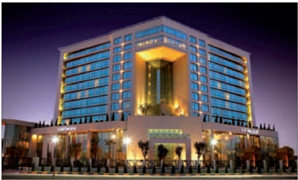
فندق أربيل روتانا

الفنادق، نحن على أتمّ الثقة بأنّ «روتانا» ستستمر في تطوير قطاع الضيافة في العراق، تماماً كما فعلنا مسبقاً من خلال افتتاح فندق «أربيل روتانا» من فئة الخمس نجوم». وأوضح بيان مشترك صادر عن الشركتين، أنّ فندق «أربيل أرجان من روتانا» يقدم شققاً فندقية راقية مجهزة بأحدث التقنيات والتي صمّمت هندسياً بشكل متطور متلائم مع احتياجات الضيوف وعائلاتهم، وقد باتت أركاناً للشقق الفندقية من «روتانا» تحتل الصدارة على قائمة عقارات «روتانا»، حيث تمثل بشموخها حياة المدينة الراقية للعائلات والراغبين في السكن لمدة طويلة، وذلك بفضل موقعها ضمن أفضل المباني المصمّمة للشقق الفندقية على الإطلاق.»