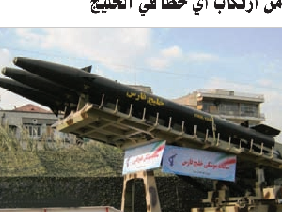
صواريخ فاتح الإيرانية

وتناول التقرير أيضاً تعاون الحرس الثوري في وقت سابق مع قوات الجيش في مجال الصواريخ، وذلك في إطار تجهيزها بنوع من الصواريخ القصيرة المدى مثل صواريخ شاهين الطولى للوقاية في هذا المجال، إلا أنه لحد الآن لم يجر تجهيز هذه القوات بصواريخ بالستية موجهة، لكن يبدو أن الاستراتيجية العسكرية الإيرانية الجديدة تقضي بتزويد قوات الجيش بأنواع من الصواريخ الباليستية الموجهة مثل صواريخ فاتح 110، وهناك جهود تبذل من أجل تطوير مدايات هذه الصواريخ.