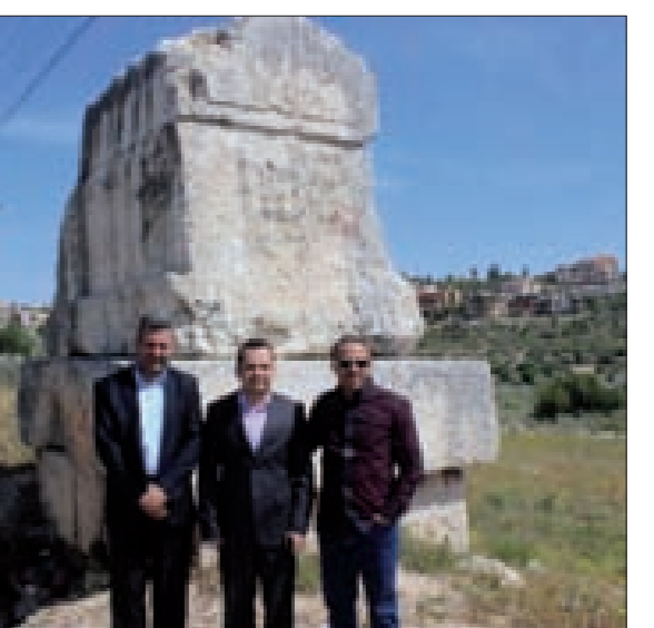
زار سفير اليمن علي أحمد الديلمي الجنوب، وكانت محطته الأولى في ثانوية «ستارز كولج» العباسية - صور، وكان في استقباله الدكتور حسن تاج الدين والهيئة التعليمية في الثانوية. بعد جولة على أقسام الثانوية وصوفوها، استمع الديلمي إلى شرح مفصل من تاج الدين عن المناهج التعليمية التي تتبناها الثانوية، لا سيما في مجال