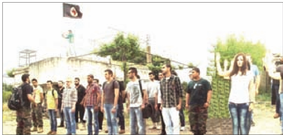
الطلبة خلال الرحلة