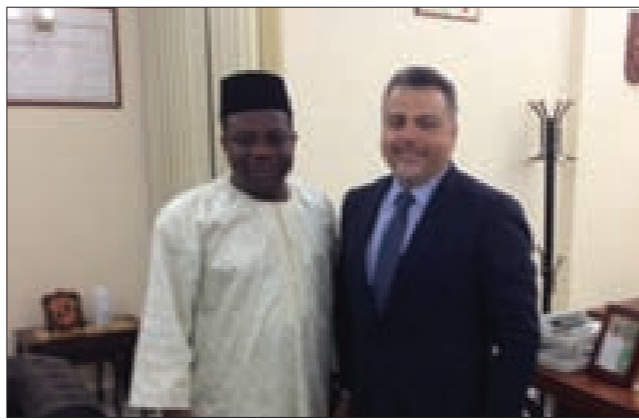
عميد الخارجية وسفير نيجيريا

وأتفق الجانبان على استمرار التواصل، وتعزيز العلاقات المشتركة.