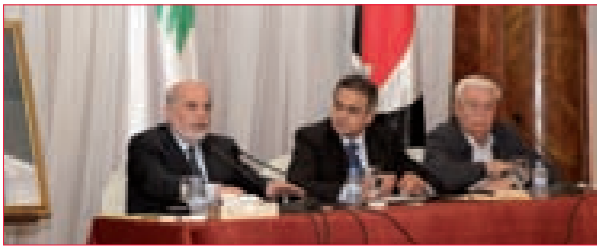
الاجتماع السنوي للمجلس القومي ناقش تقريري السلطين التشريعية والتنفيذية 3