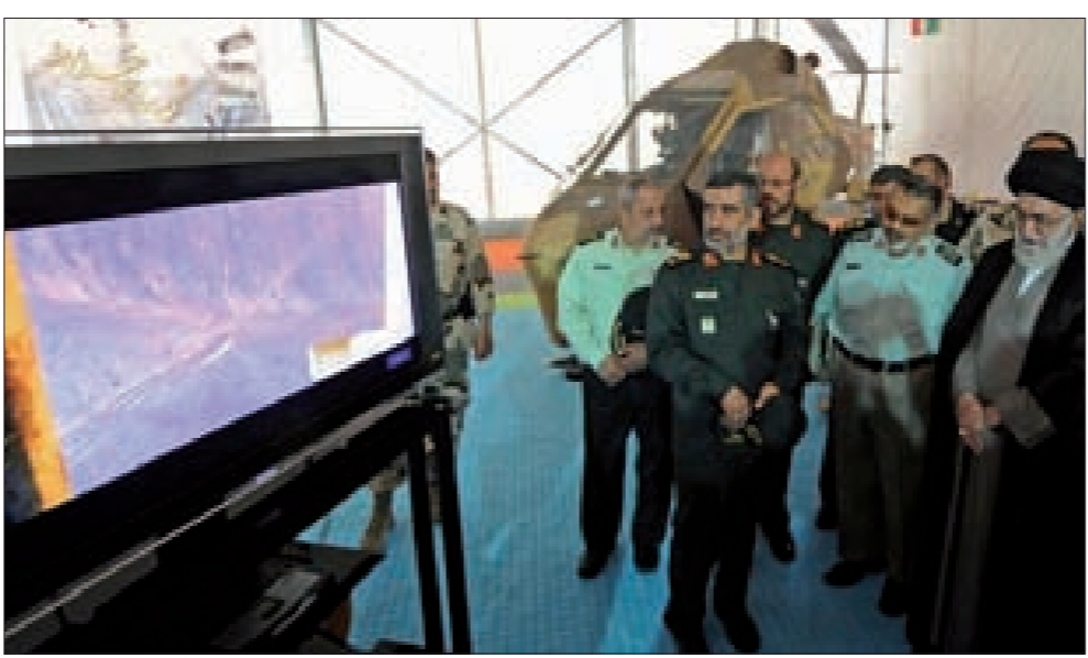
السيد خامنئي خلال تفقده معرض إنجازات الجوفضائية

وفي هذا الإطار، أكد الرئيس الإيراني أمس، «أن إيران لن تقبل بالتمييز النووي والعلمي للتحلي عن برنامجها النووي، وأنها لن تتراجع أية خطوة في مجال الطاقة النووية». وكشف روحاني عن ثلاثة إنجازات نووية إيرانية جديدة: جهاز طرد انبوبي لإنتاج الفلحات التركيبية للإنسان والحيوان، ومنظومة رصد الأشعة ما وراء البنفسجية، ومنظومة إطلاق الأشعة متعددة الاستعمالات من نوع غاما. وقال روحاني في مقر المنظمة الإيرانية للطاقة النووية إن: «بلادنا لم تسلك طريقاً خاطئاً حتى تعود عنه لكنها مستعدة لإظهار الشفافية. وجدد روحاني رفض بلاده للداعات في شأن سعيها لامتلاك سلاح نووي، مؤكداً «أن طهران لم تقم بأي نشاط سري، واصفاً من يروج لهذه الداعات بالكاذب».