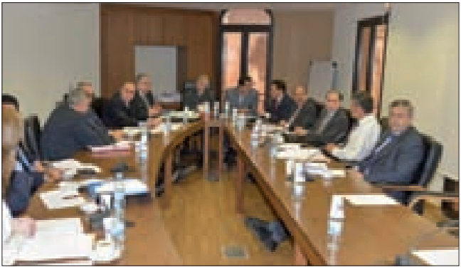
لجنة الإدارة والعدل مجتمعاً في ساحة النجمة (تثون)