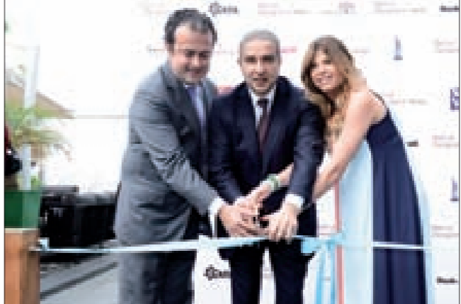
فرعون خلال افتتاح المعرض

ويشارك في المعرض 79 مصمماً لبنانياً عرضوا آخر تصاميمهم لموسم ربيع – صيف 2014 التي تتضمن الألبسة اليومية واللبسة السهرة، والمكسسورات من توقيع 15 مصممة وشراكة في المعرض. وقد لقي الحدث إقبالاً كثيفاً على مواقع التواصل الاجتماعي، فحصدت صفحة المعرض الرسمية أكثر من 11000 متابع.