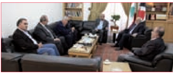
حردان يدعو لمقاربة موضوعية تحقق العدالة وتنصف المالك والمستأجر 2