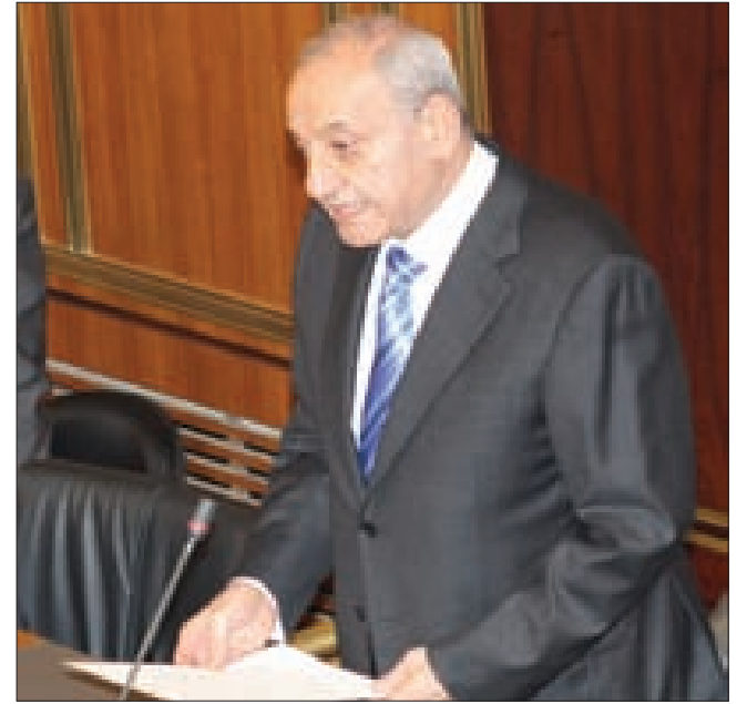
بزي يقرأ رسالة رئيس الجمهورية