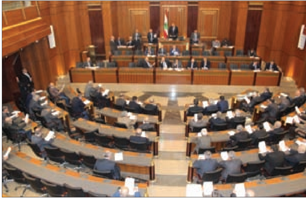
الهيئة العامة خلال الجلسة أمس