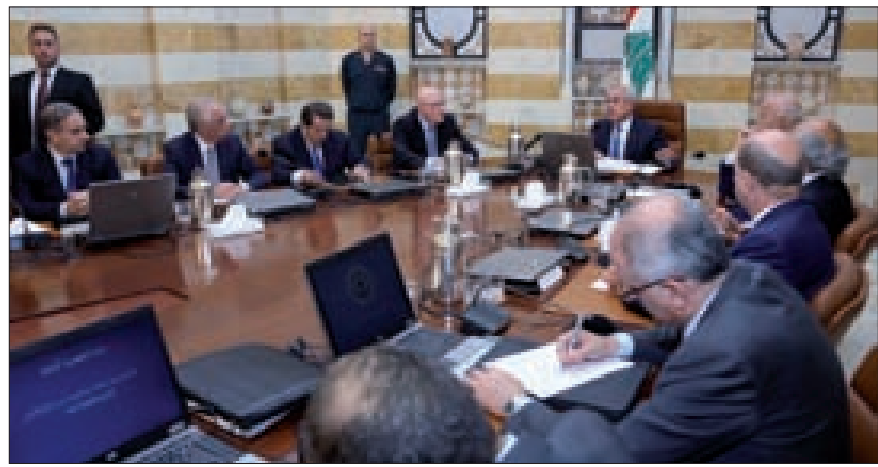
الجلسة الأخيرة لمجلس الوزراء في بعيدا (اللاتي ونهرا)