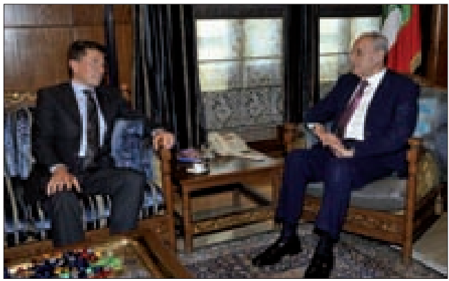
بري مستقبلاً فليتشر في عين التينة

استقبل رئيس مجلس النواب نبيه بري السفير البريطاني في لبنان طوم فلتشر وعرض معه الأوضاع الراهنة في لبنان والمنطقة. وقال فليتشر بعد اللقاء: «من الواضح والمحزن أن الوقت يمر بسرعة على البرلمان لانتخاب رئيس للجمهورية في المهلة الدستورية، ونأمل في هذه الساعات والأيام القليلة أن يركز اللبنانيون على الإجماع والوحدة في المهام التي تواجههم». وأضاف: «منذ بداية هذه العملية أعلننا أن دورنا ودور المجتمع الدولي هو إزالة العقبات للقيام باتفاق حول الرئاسة داخل لبنان، ومن قبل اللبنانيين، وهذا ما حاولنا القيام به. وإننا نؤمن بأن اللبنانيين هم الذين يختارون رئيسهم، ونحن نريد شريكاً هنا لكي نعمل معاً لدعم الأمن والعدالة وتحقيق الفرص للبنانيين».