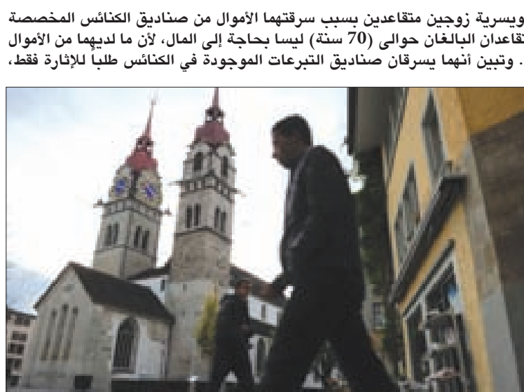
اعتقلت الشرطة السويسرية زوجين متقاعدتين بسبب سرقتهم الأموال من صناديق الكنائس المخصصة للترتعات. الزوجان المتقاعدان البالغان حوالي (70 سنة) ليسا بحاجة إلى المال، لأن ما لديهما من الأموال يكفيهما لسنوات طويلة، وتبين أنهما يسرقان صناديق التبرعات الموجودة في الكنائس طلباً للإثارة فقط، حيث كانت الزوجة تسرق والزوج يراقب الوضع لكي لا يكتشف أمرهما.

ويشير الزوج إلى أنه لم يسبق لهما أن انتهكا القوانين السارية أبداً، وأن هذه هي السرققة الأولى لأموال كنيسة قاما بها المفير في الأمر أن كل ما سرقاه لا يتعدى بضع مئات من الفرنكات السويسرية.