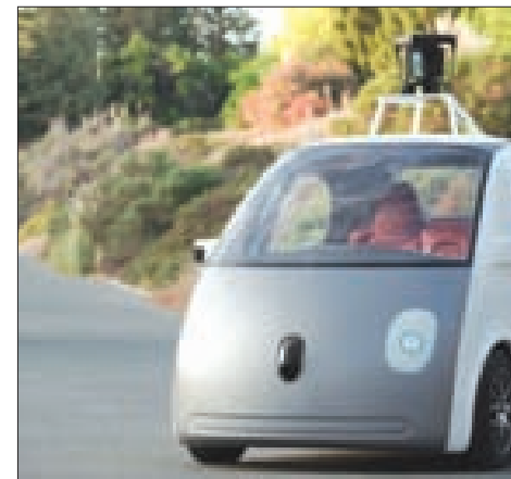
قدمت شركة «غوغل» أول سيارة ذاتية الحركة من تصميمها بالكامل، وتتسع السيارة من فئة هاتشباك سوبر ميني لراكبين ولا تحتاج إلى عجلات قيادة أو دواسات، بل يتم التحكم فيها بواسطة جهاز حاسب آلي وعدد كبير من أجهزة الاستشعار. وعلى رغم أنه سبق لـ «غوغل» أن استعرضت مراراً تكنولوجياتها للسيارات الذاتية الحركة، كان يتم دائماً تركيب معداتها على سيارات من الإنتاج المتسلسل لكبرى الشركات العالمية المصنعة للسيارات. وتقرر إنتاج نحو مئة سيارة من هذا النوع لاختبارها في صيف هذا العام، ويهدف المشروع إلى إنتاج سيارات أكثر أماناً من السيارات التي يتحكم فيها البشر، حيث يلقى نحو 33 ألف شخص في الولايات المتحدة ونحو 1.2 مليون شخص حول العالم مصرعهم في حوادث الطرق سنوياً.

ويشير الزوج إلى أنه لم يسبق لهما أن انتهكا القوانين السارية أبداً، وأن هذه هي السرققة الأولى لأموال كنيسة قاما بها المفير في الأمر أن كل ما سرقاه لا يتعدى بضع مئات من الفرنكات السويسرية.