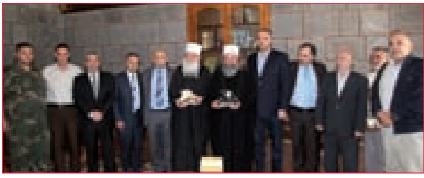
حردان يكزّم مشايخ العقل ومطران السويداء ويمنحهم دروعاً تقديرية