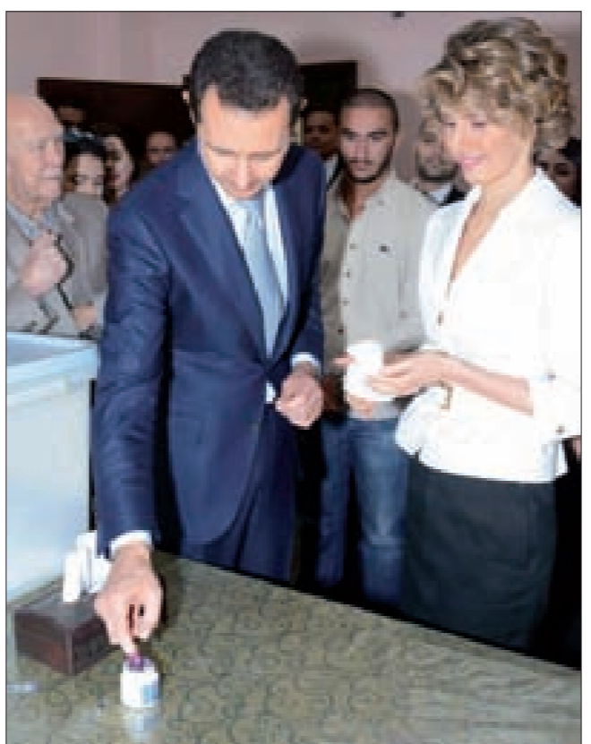
الرئيس الأسد والسيدة عقيلته خلال الإذلاء بصوتيهما في حي المالكي

توصلت الحكومة اللبنانية إلى تقاسم صلاحيات رئيس الجمهورية في ما يخص حق التوقيع، وهو حق يناله رئيس الحكومة إلى جانب رئيس الجمهورية في كل التوقيع، فلم يكن ثمة حاجة للتأكيد على حقه بالتوقيع، بل كان الإصرار على هذا التوقيع لجعله مزدوجاً تكرساً لتولي رئيس الحكومة المعنوية لرئيس الجمهورية، فيضيف توقيعاً إلى توقيع مرة ثانية، كما فعل الرئيس فؤاد السنورة بحكومته البتراء التي استولت على صلاحيات رئيس الجمهورية بعد نهاية ولاية الرئيس إميل لحود، ما استدعى رفض الرئيس نبيه بري استقبال كل ما كان من ضمنها بصيغة مشاريع قوانين مرسلة للمجلس، بصفتها مراسيم غير شرعية، واستدرك التوقيع هذه المرة بإضافة توقيع الوزراء لتوقيع رئيس الحكومة، خصوصاً ما يحتاج إقراره إلى ثلثي مجلس الوزراء.