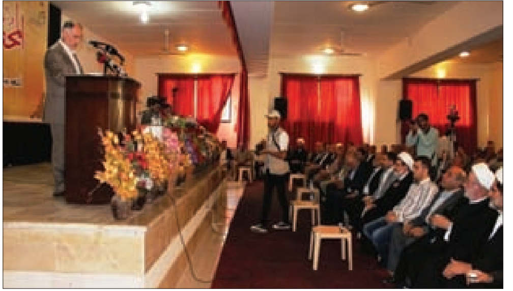
فنيش متحدثاً في المؤتمر