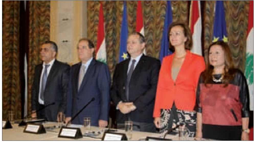
خلال إطلاق الاتفاقية

أطلقت وزارة التنمية الإدارية بالتعاون مع الاتحاد الأوروبي، من السراي الحكومية، وبرعاية رئيس مجلس الوزراء تمام سلام ممثلاً بوزير التنمية الإدارية نبيل دوفريج، اتفاقية «تعزيز اللحمة الاجتماعية في لبنان» الذي يهدف إلى تمويل مشروع البيانات الإحصائية الذي يتلخص بتعزيز قدرات إدارة الإحصاء المركزي، ومشروع تعزيز الضمان الاجتماعي، والممول بجهة من المجموعة الأوروبية بقيمة 10 ملايين يورو.