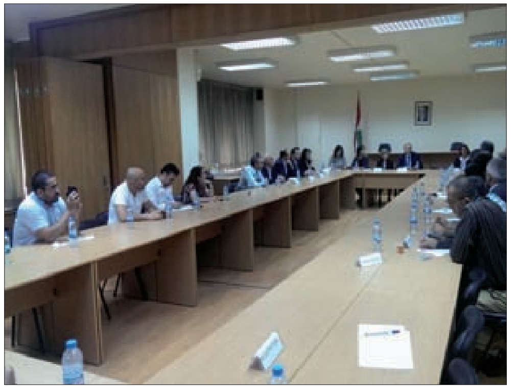
دو فريج مجتمعاً إلى الاتحادات البلدية

● ترأس وزير الدولة لشؤون التنمية الإدارية نبيل دي فريج اجتماع عمل للإعلان عن موافقة مجلس الوزراء على تمديد مشروع تشغيل وصيانة معامل معالجة النفايات الصلبة التي تم تشييدها وتجهيزها من قبل الوزارة بتمويل من الاتحاد الأوروبي، لمصلحة المجالس البلدية والاتحادات في المناطق، وزيادة موازنة المشروع وذلك لمدة ثلاث سنوات إضافية. وحضر الاجتماع ممثلين عن البلديات والاتحادات المعنية، ومنها اتحاد بلديات قضاء صور، اتحاد بلديات النبطية - الشقيف، اتحاد بلديات الفياض، اتحاد بلديات المنية، تجمع اتحادات بعليد - الهرمل، بلدية الخيام، بلدية قريخا، بلدية خربة سلم وبلدية منمش. وتمّ التداول بألية التمويل والمراقبة التي يتم اتباعها من قبل مكتب الوزير.