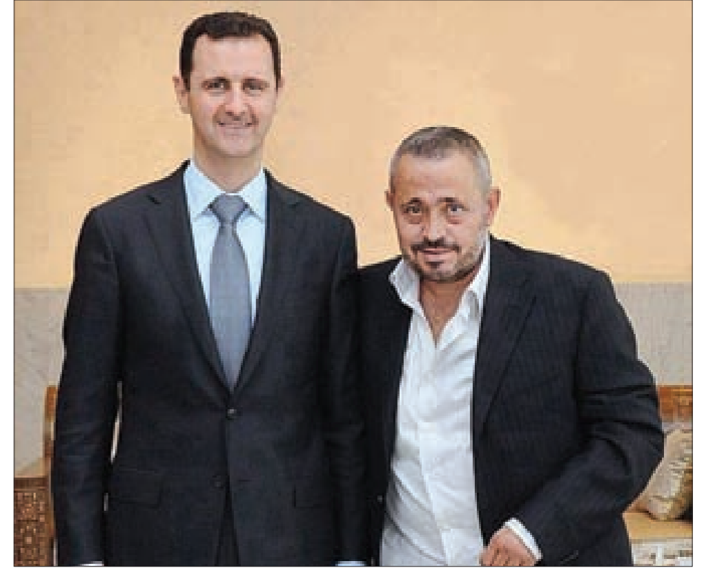
استقبل الرئيس السوري بشار الأسد سلطان الطرب جورج وسوف ونجله وديع في قصر المالك. وتأتي الزيارة بعد أيام من المقابلة التي أجراها الـسوف ضمن حلقة «قول يا ملك» على قناة «الجديد»، والتي وجه خلالها الـسوف تحية تقدير إلى الرئيس السوري، وعبر فيها بطريقة مؤثرة عن تعلقه بوطنه، وعن رفضه كل أشكال الإرهاب الذي يمارس ضد الشعب السوري، كما أعلن تأييده المطلق للخط المقاوم الذي تشكل سورية حاضنته، معرباً عن تقديره أيضاً للأمين العام لحزب الله السيد حسن نصر الله. وقد أثنى الرئيس الأسد على هذه المقابلة، وشكر الـسوف على النقة التي أعطاهما للقيادة السوريّة.

بيّنت نتائج البحوث التي أجراها العلماء، أنه بعد بلوغ الشخص الخمسين من العمر يؤدي مستوى ضغط الدم إلى إضعاف عمل الدماغ وبالذات فقدان الذاكرة. توصل العلماء إلى هذا الاستنتاج بعد سنوات طويلة من البحث والتجارب التي شارك فيها أربعة آلاف شخص أعمارهم فوق 50 سنة. راقب العلماء حالة هؤلاء الأشخاص خلال فترة ربيع قرن من الزمن، وعندما بلغوا الـ 76 سنة من العمر جرى فحص دماغهم بواسطة التصوير بالرنين المغناطيسي. بيّنت نتائج هذا الفحص، أن الأشخاص الذين يعانون من ارتفاع ضغط الدم يعانون من مشاكل في الذاكرة، إضافة إلى أن ارتفاع ضغط الدم يسبب الخرف، ويعجل في تصبب الشرايين والقصور في عمل القلب واختلال نبضاته، وهو سبب أساسي لاحتشاء عضلة القلب والسكتة الدماغية في عمر الشباب. ويشير الخبراء إلى أن خطورة ارتفاع ضغط الدم، تكمن في أنه يكون من دون أعراض تذكر في المراحل الأولى. لذا إذا لم يشخص منذ البداية ولم تتخذ إجراءات علاجه في الوقت المناسب، فإنه يؤدي إلى إصابة القلب والأوعية الدموية بأمراض مختلفة. تبين الإحصائيات، أن حوالي ثلث سكان بريطانيا وأستراليا يعانون من مشاكل في ضغط الدم، وأن نصفهم لا يبالون بذلك. كما تبين الإحصائيات أن النساء أكثر عرضة للإصابة باحتشاء عضلة القلب «الجلطة»، مع أن مستوى ضغط الدم لديهن يبقى ضمن الحدود الطبيعية إلى حين بلوغهن سن اليأس، حيث ينخفض مستوى هرمون الاستروجين، ما يؤدي إلى ارتفاع مستوى ضغط الدم بصورة مفاجئة أحياناً.