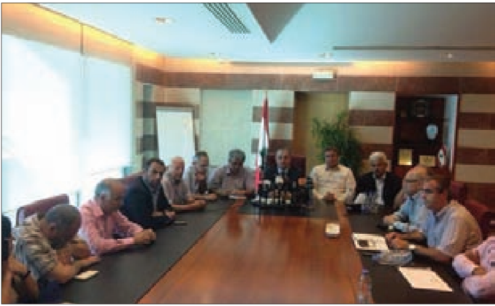
يو صعب وأعضاء هيئة التنسيق خلال المؤتمر الصحافي

ولفت غريب إلى أن «السؤال الذي يناقش في موضوع الاتصالات، هو كيف ستكون السلسلة، والهيئة قدمت جواباً لوزير التربية في كتاب خطي يتضمن مجموعة من التوابت حول كيفية الحفاظ على الحقوق في