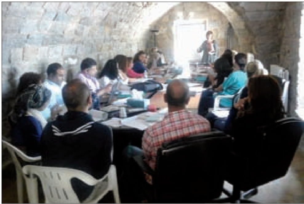
خلال الدروس في ورشة العمل

وتحورت أهداف الورشة حول تنمية قدرات كتاب ورسمين متخصصين في أدب الأطفال لإنتاج أعمال كتابية تستهدف الأطفال الذين يعانون صعوبات في القراءة ويطءوا في الاستيعاب، ما يؤدي إلى غياب المتعة في الكتاب وعدم الرغبة في القراءة. أكان ذلك للتعليم أو للاستمتاع. كما توخت الورشة تبادل خبرات بين المتدربين من جهة، وبينهم وبين المتدربين من جهة ثانية، للوصول إلى أدب أطفال دامج. وبمناسبة اختتام الورشة، أقيم احتفال رمزي في المركز الإنجليزي للمؤتمرات، وُزعت خلاله الشهادات على المتدربين، كما أقيمت كلمات حول أهمية الاستفادة من الدروس والمحاضرات والتدريبات التي أجريت، ووضع الخطوة الأولى في «مشوار الألف ميل»، كما ركزت الكلمات على حقوق الأطفال ذوي الاحتياجات الإضافية في قصص يجدون أنفسهم فيها، وفي قصص يستطيعون قراءتها بأقل صعوبات ممكنة.