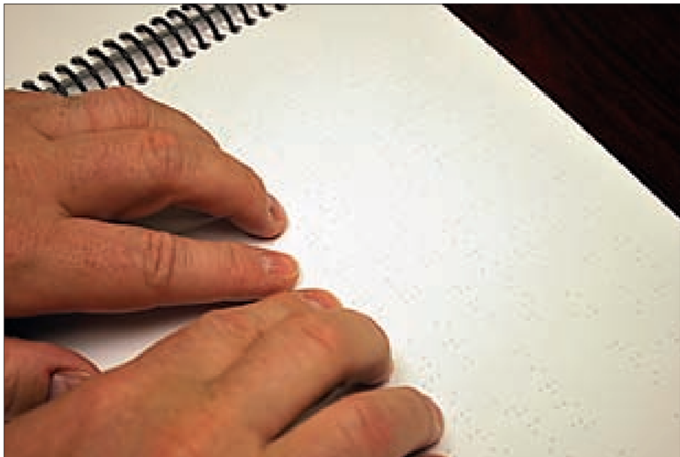
تحقيق ريماء يوسف

وأشارت إلى أن معنويات هؤلاء زملائهم في صفوف عادية، عبر برنامج الدمج المتبع عادة، ويتم تلقينهم المعلومات شفهيًا وبيدونيًا عبر طريقة «برايل»، مؤكدة أنهم يدرسون كل المواد باستثناء بعض الرسومات.