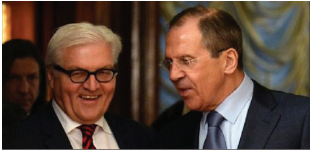
لافروف ونظيره الألماني

بحث وزير الخارجية الروسي سيرغي لافروف مع نظيره الألماني فرانك شتاينماير في اتصال هاتفي أمس الوضع في أوكرانيا. إذ أشار بيان صادر عن الخارجية الروسية إلى أن الاتصال جاء بمبادرة من الطرف الألماني. وأضاف البيان الروسي أنه «جرى تبادل الآراء حول الوضع في أوكرانيا وركز لافروف على ضرورة وقف العنف في جنوب شرقي البلاد وبدء حوار شامل وحقيقي»، مشيراً إلى أنه جرى تناول إلى بعض تصريحات سلطات كييف التي تدل على محاولة لاستبدال الحوام الوطني بمشاركة جميع الأقاليم بخطم قمع الاحتجاجات في منطقتي دونيتسك ولوغانسك.