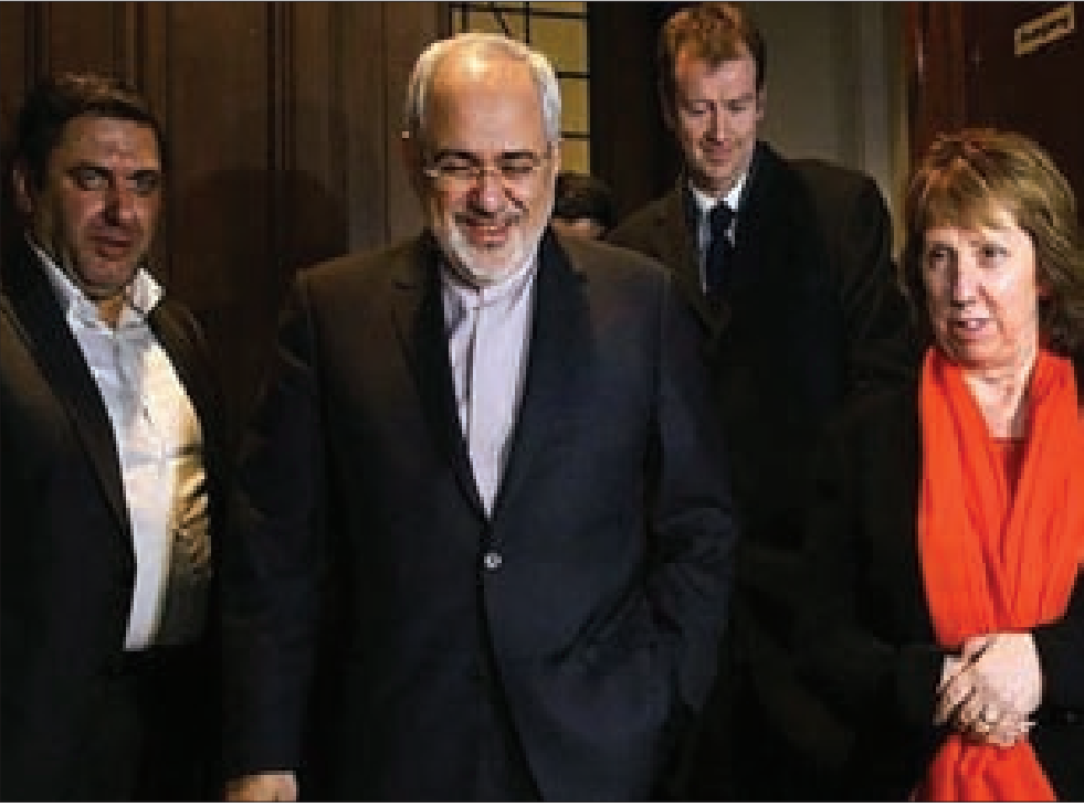
ظريف وآشتون في جنيف

وقال فاليري بولوتوف رئيس جمهورية «لوغانسك الشعبية» إن مزاعم النيابة الأوكرانية حول مسؤولية قوات الدفاع الشعبي عن مقتل الصحافيين الروسيين، كاذبة وملفقة، وأضاف: «كما تعلمون أنه كذب جديد. الصحافيون قتلوا جزءاً قصف استهدفهم عمداً»، وأكد العثور على «رصاصات قصص في جسد أحد الصحافيين». وقال فاليري بولوتوف رئيس جمهورية «لوغانسك الشعبية» إن مزاعم النيابة الأوكرانية حول مسؤولية قوات الدفاع الشعبي عن مقتل الصحافيين الروسيين، كاذبة وملفقة، وأضاف: «كما تعلمون أنه كذب جديد. الصحافيون قتلوا جزءاً قصف استهدفهم عمداً»، وأكد العثور على «رصاصات قصص في جسد أحد الصحافيين».