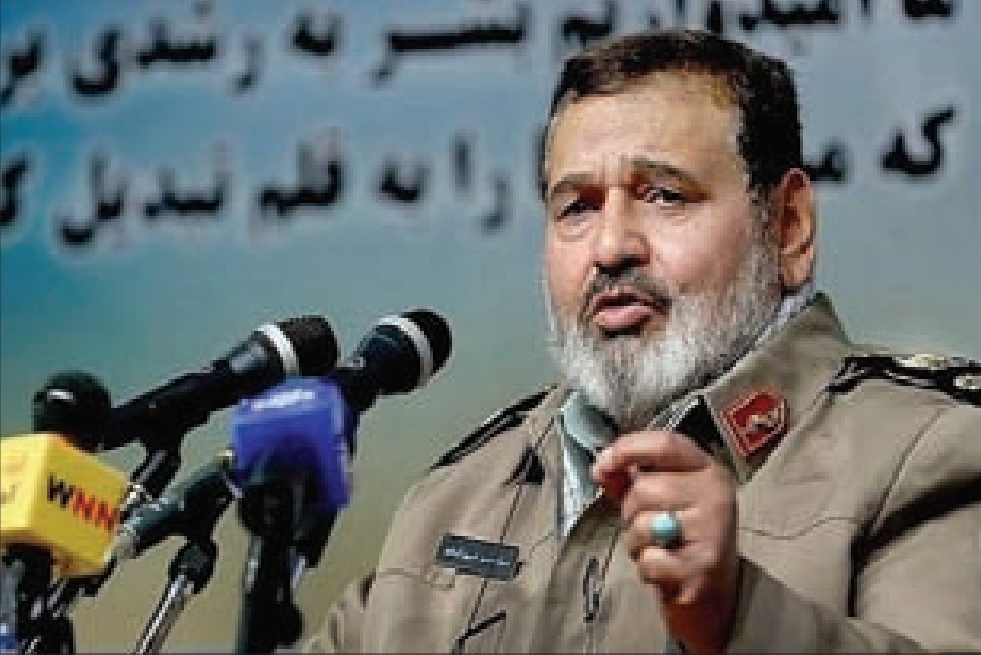
أعمال داعش تاتي في إطار مخطط صهيوني

أزمة العلاقات الروسية - الأوكرانية تمر بمحطات عديدة أبرزها ملك الغاز. وفي آخر تطوراتها تهديد مسؤول حركة «القطاع الأيمن» المتطرفة بتدمير البنى التحتية لخط أنابيب نقل الغاز الروسي. وقد شاب العلاقات الروسية - الأوكرانية كثير من التعقيدات والتدخلات تحت ضغط ملك الغاز، فبينما حاولت السلطات الأوكرانية الجديدة استغلال تفجير خط الأنابيب الذي ينقل الغاز الروسي عبر أوكرانيا إلى المستنك الأوكراني لتأكيد صحة توقعاتها بوجود أعمال استنزافية للمساس بسبعة البلاد كمورد مضمون للغاز، اعتبر ممثلو شركة «غازبروم» الروسية الحادث عرضياً، وإن لم يستبعدوا تكراره، لكن لأسباب تتعلق بتقص تمويل أعمال صيانة الأنابيب من قبل الجانب الأوكراني. الطرف الروسي مع ذلك أشار إلى أن الانفجار لم يؤثر حتى الآن في كمية الغاز الروسي الذي يضخ إلى أوروبا لوجود خط بديل عبر أوكرانيا. في حين تحدثت داخلية كييف عن انفجار قوي في خط الأنابيب «أورينغوي - بوماري - أوجغوروف» في مقاطعة بولتافا الأوكرانية، سببته عبوة ساقطة توالى على إثرها انفجاران أدبا إلى