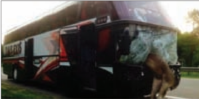
فوجئت حافلة كانت تسير على الطريق السريعة في مدينة منسك عاصمة بيلاروس بظهور غزال ضخم من الحقائق التي توجد على جانبي الطريق، فلم تستطع الحافلة تفاديه، ما أسفر عن اصطدام رأس الغزال بالجهة الأمامية بالحافلة وتهشم زجاجها الأمامي.

ليس من العار أن يتولى نتناهاو التحقيق في عملية سرقة تاريخ فلسطين وجغرافيتها وحضارتها وتغيير معالم مدنها وقراها وزواربها وحاراتها وأسماء شوارعها وسرقة بساتين برتقالها وزيتونها وسهول قمحها وكروم عنبها وبياراتها ومياه نايبيها؟ ليس من العار أن تعين الأمم المتحدة من سرق آثار فلسطين وحجارة بيوتها القديمة وأثرها وموسيقى شعبيها وأغانيتها ورقصاتها الوطنية والأون ثيابه وأسماء أزهاره وحتى أكات اللغلاف والحمص والغول قِماً على تاريخ هذا الشعب ومستقبله؟ في ظل الأزمات التي تشهدها الأمة، هل الخيار الأممي هذا مقدمة فعلية للبدء في تنفيذ مشروع الدولة اليهودية فيكمّل نتناهاو حرب «الإبادة المقدسة» ضد الفلسطينيين ويكملها بطرد من تبقى منهم في كامل فلسطين التاريخية وينفذ الوعد التوراتي بإقامة هيكل سليمان في القدس بعد هدم ما تبقى من المسجد الأقصى الذي يدعي حكماء بني «إسرائيل» زوراً أنه أقيم على أنقاض الهيكل؟ استشرّف أطون سعادة هذه المرحلة فكتب عام 1938: «لا ينحصر خطر اليهود في فلسطين، بل هو يتناول لبنان والعراق أيضاً، إنه خطر على الشعب السوري كله، لا، لن يكتفي اليهود بالاستيلاء على فلسطين، ففلسطين لا تكفي لإسكان ملايين اليهود (...). إن الصراع بيننا وبين اليهود لا يمكن أن يكون فقط في فلسطين بل في كل مكان حيث يوجد يهود قد باعوا هذا الوطن وهذه الأمة بغضه من اليهود. إن مصيبتنا بيهودنا الداخليين أعظم من بلاتنا باليهود الأجانب».