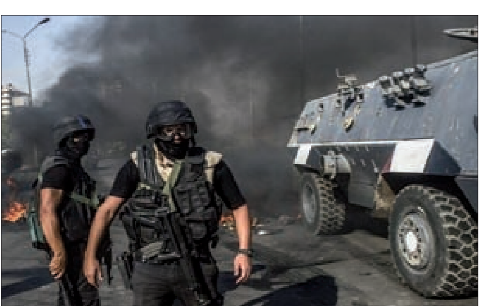
خلال المواجهات مع الجماعة الإرهابية

وكان أنصار الجماعة تجمعوا أمام مسجد بالمنقلة، عقب أداء صلاة الجمعة، وذلك تمهيدا للخروج بمسيرة.