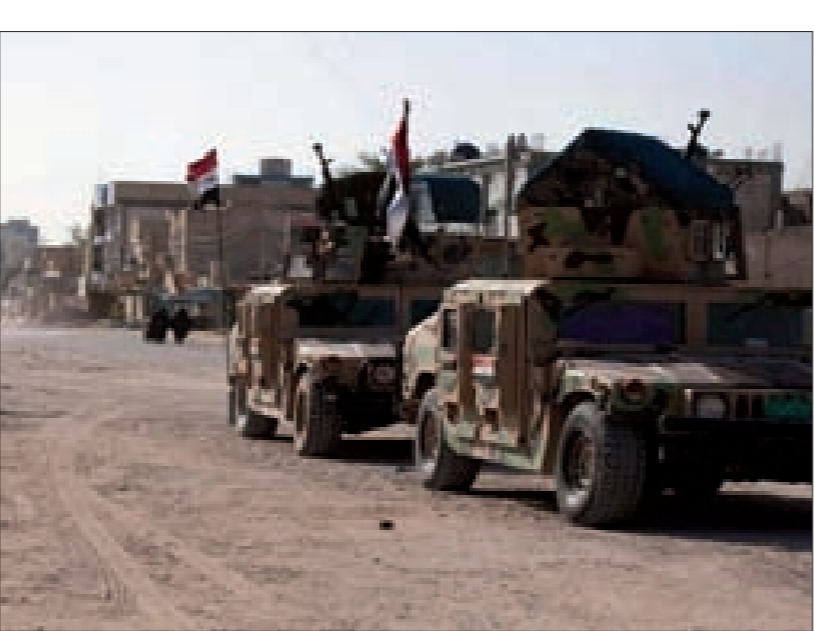
قوات عراقية نحو مواقع القتال

من جهة أخرى، أعلن البرلمان الدولي للأمن والسلام من خلال مكتب نائب وزير خارجيته السفير هيثم أبو سعيد أن مسؤول تنظيم «داعش» أبو بكر البغدادي قد أصيب في غارة جوية في مدينة القائم غرب العراق من قبل الطيران الحربي العراقي.