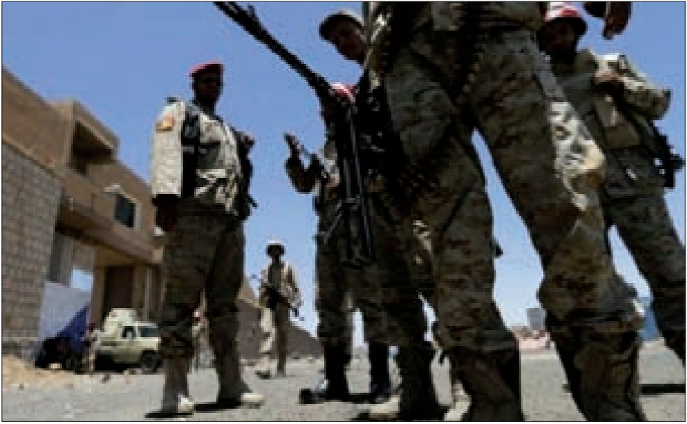
الجيش اليمني يستعين بالتكفيريين والقبائل

ويعتقد أن خمسة آلاف عائلة أخرى لا تزال عالقة داخل المدينة، الواقعة على بعد 50 كلم من العاصمة صنعاء، بعدما سيطر المتمردون على مناطق عديدة. وقد اندلعت المعارك الحالية الأسبوع الماضي، بعد خرق وقف لإطلاق النار استمر أقل من أسبوعين بين قوات الجيش والمقاتلين الحوثيين.