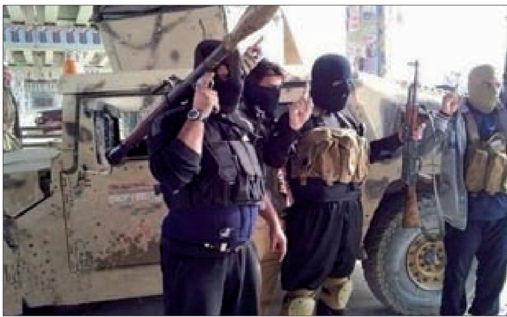
عناصر من داعش

على صعيد آخر، عذرت الشرطة العراقية أمس على 53 جثة مجهولة الهوية داخل أحد البساتين الواقعة بالقرب من مدينة الحلة مركز محافظة بابل جنوبي بغداد. وأفادت مصادر أممية أن «جميع الجثث في لرجال مجهولي الهوية قضوا بطلقات نارية بالرأس والصدر ولا تزال أديهم مقيدة إلى الخلف».