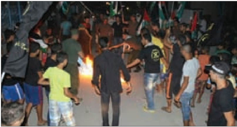
... وحركة الجهاد الإسلامي في مخيم الرشيدية

لكن لا، وإن صمت عربان البترول وملاهي لاس فيغاس، فإنّ لفلسطين محبين لا يبرد جمر حبّهم لها، وهم في كل مكان ومناسبة، يعلنون انتماءهم لفلسطين، ويجددون التأكيد بأنّها اليوصلة والقضية.