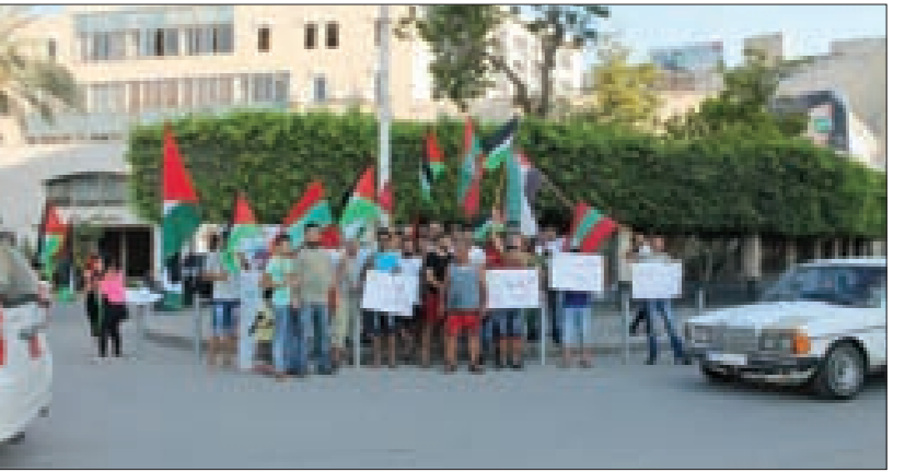
الوقف التضامنية لشباب التنظيم الشعبي الناصري