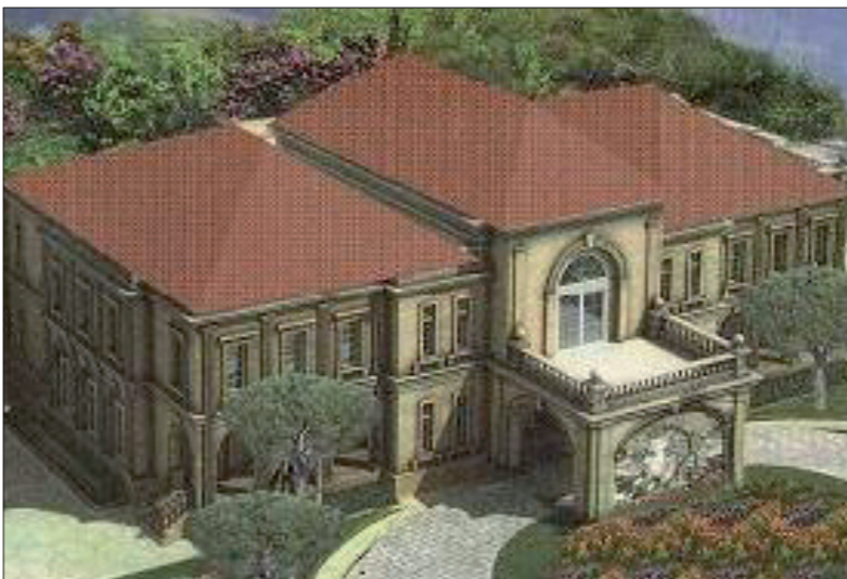
دار سعادته للثقافة تعمل عليها قيادة الحزب ويهتم الرفقاء وأصدقاؤه بتحقيقه صرحاً عملاقاً ومفخرة لحزب يستمتع أن يحقق الكثير