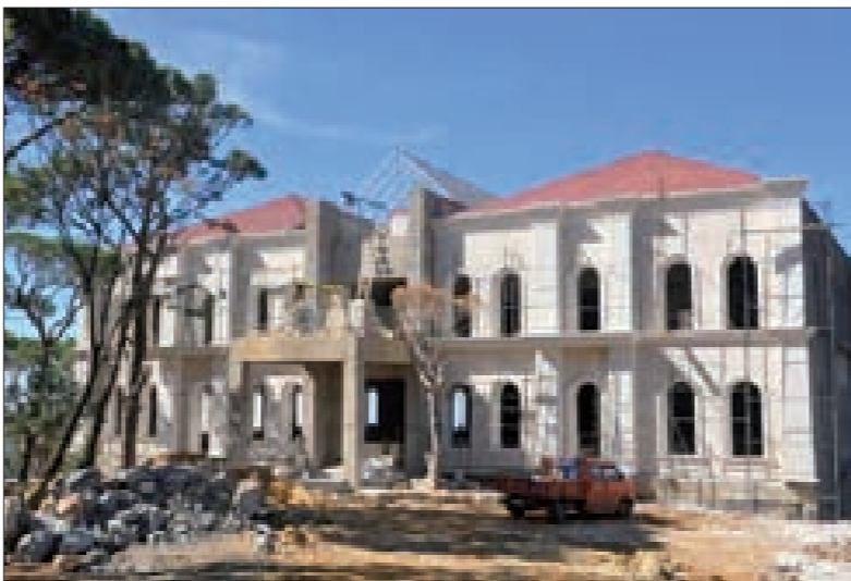
الدار في مراحل البناء الاخيرة