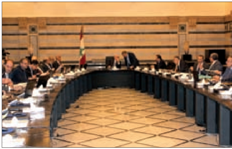
سلام مترشداً مجلس الوزراء في السراي الحكومية (تموز)