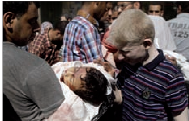
مجازر الكيان الصهيوني تتكاثر

بين منطقة وأخرى داخل إسرائيل. فالدن البعيدة من غزة، لم تعد آمنة ولكنها لا تزال بنسبة معينة مطمئنة لكونها تعيش في ظل أمن نسبي توفره المشكلة مختلفة في منسوب حدثها