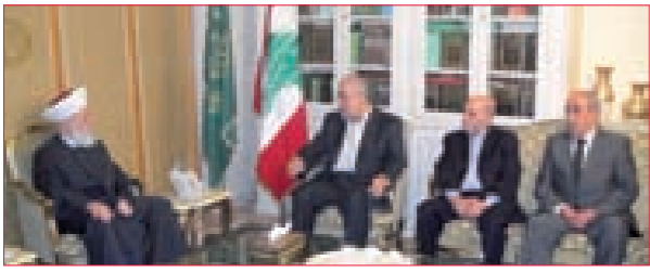
رعد من دار الإفتاء: جيد أن يستفيق البعض على أهمية المقاومة