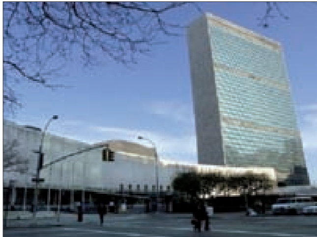
تحويل الأمم المتحدة إلى منبر لها، وهذا طريق مسدود، موضحاً أن الولايات المتحدة تريد نشر الإزهاب في إيران وفي روسيا لكنها عاجزة عن ذلك.

وفي ما يخص الوضع في الشرق الأوسط، أشار الدبلوماسي إلى أن الغرب يسعى إلى إعادة رسم خريطة المنطقة لتصبح تحت النزاعات المذهبية والدينية. وفي شأن آخر، أكد المدير العام لمنظمة حظر السلاح الكيماوي أحمد أوزموجو أن ثلث المواد الكيماوية التي خرجت من سورية تم تدميرها.