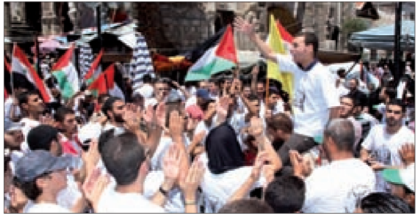
... والسوريون يحيون يوم القدس