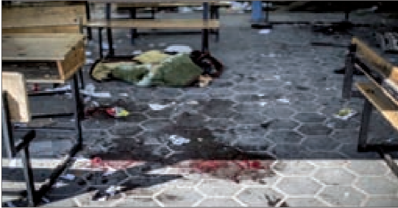
مدرسة الاونروا التي قصفها العدو