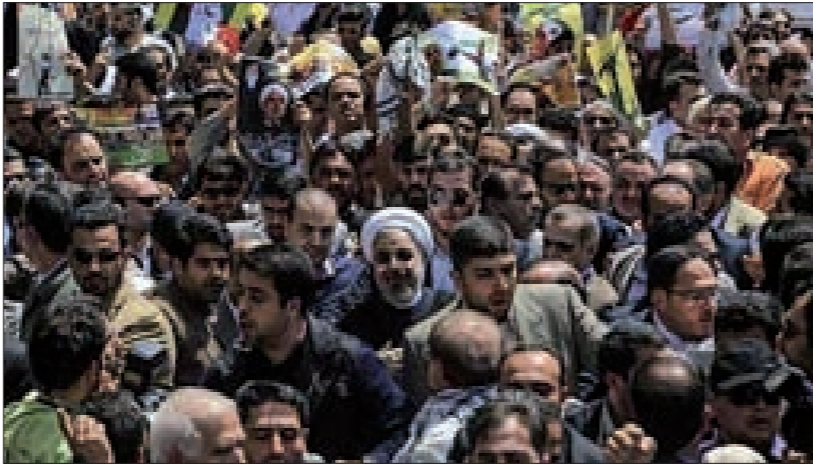
الرئيس الإيراني يشارك في إحياء يوم القدس