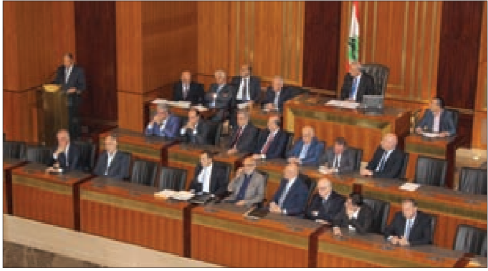
التراسة والحكومة خلال جلسة الموصل وغزة

في الكلمات التضامنية التي تلاها ممثلو الكتلة السياسية رسائل سياسية مبجلة واتهامات وتحميل مسؤوليات