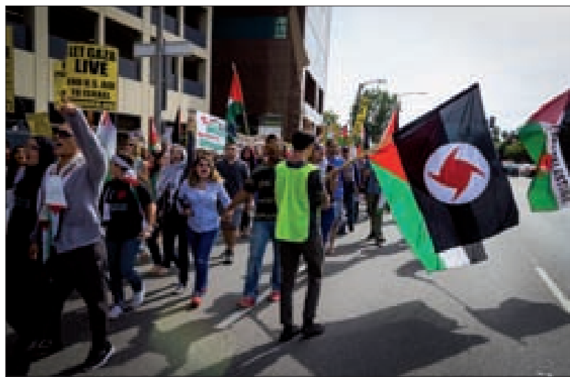
جانبا من الميسيرة في لوس أنجلوس