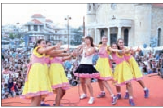
من مهرجان الأطفال

إلى ضهور الشوير لاستمتاع بتلك النشاطات. وفي جدول النشاطات ضمن عيد المغتربين، تنظم البلدية برعاية قائد الجيش العماد جان قهوجي، احتفالاً بمناسبة عيد الجيش، في تمام النامته من مساء غد الجمعة، في الشارع الرئيس في ضهور الشوير. ويتضمن الاحتفال معروضات وطنية لموسيقى الجيش، وكلمات الرسامين واستعراضاً فولكلوريا وزجلاً من وحي المناسبة مع «جوقة الأرز». ويختتم بحفل فني يحييه الفنان محمد اسكندر.