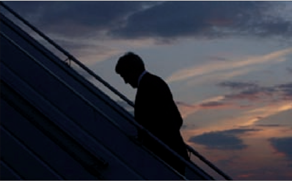
المقاومة تخيّب آمال كيري

وتحت عنوان «مفاجأة مصرية خلال ساعات وتعديلات على المبادرة»، قالت صحيفة «العرب اليوم» الأردنية: «إن قادة وممثلي الفصائل الفلسطينية بما فيها حماس يعدون اجتماعاً في القاهرة برعاية