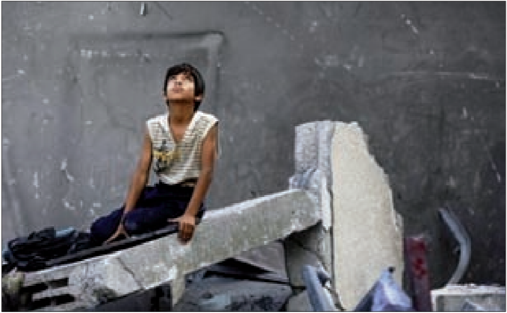
أرضي هنا وبيتي هنا... ولن أسامو

إزاء المبادرة المصرية بشأن وقف إطلاق النار والهدنة في غزة».