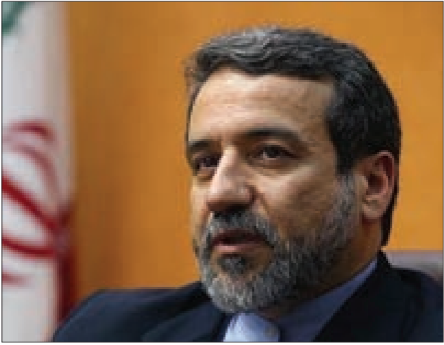
مساعد وزير الخارجية الإيراني

من المحادثات والمفاوضات المكثفة بينهما في فيينا في إطار الجولة السادسة من المفاوضات المتعلقة بالحل النووي النهائي شامل. ووفقاً لوثيقة (Non-Paper) فقد تعهدت الحكومة الأميركية وفقاً لشروط وضوابط اتفاق جنيف نفسها والتي هي في الواقع الإفراج عن 4 مليارات و 200 مليون دولار إزاء خفض تصدير المواد المخصبة بنسبة 20 في المئة ومن ثم أكسبتها. بالعمل على الإفراج عن مليارين و 800 مليون من الأموال الإيرانية المجمدة في الخارج في غضون 4 أشهر.