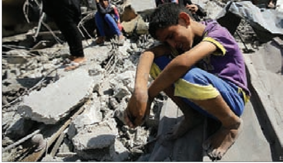
هنا كان بيتي... هنا سيبقى بيتي

مفعوله صباح الجمعة 1 آب. وقال سري في بيان: «إن الأنباء الواردة عن مقتل جنديين «إسرائيليين» وعدد من الفلسطينيين في رفح جنوب قطاع غزة، تعد في حال تأكيدها انتهاكاً خطيراً من جانب