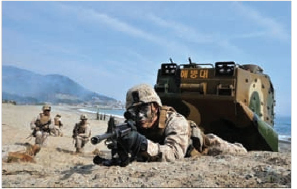
مناورات مشتركة أميركية-كورية جنوبية

ومن المقرر أن تبدأ المناورات المشتركة بهدف اختبار الجاهزية القتالية في حال حصول اجتياح كوري شمالي، في 18 آب. وعلى رغم أن المناورات ستجري أساساً بواسطة أجهزة الكمبيوتر، إلا أنها تشمل عشرات آلاف الجنود الكوريين الجنوبيين والأميركيين.