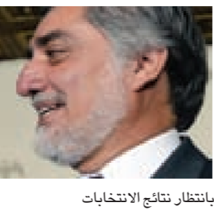
بانتظار نتائج الانتخابات