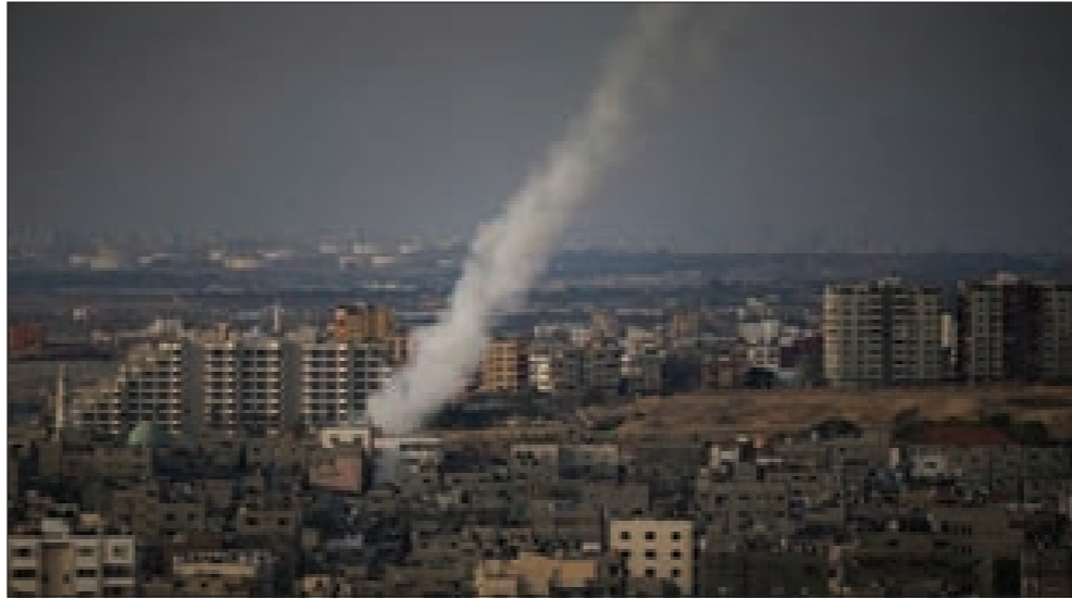
طيران العدو يتابع قصفه للمواقع المدنية