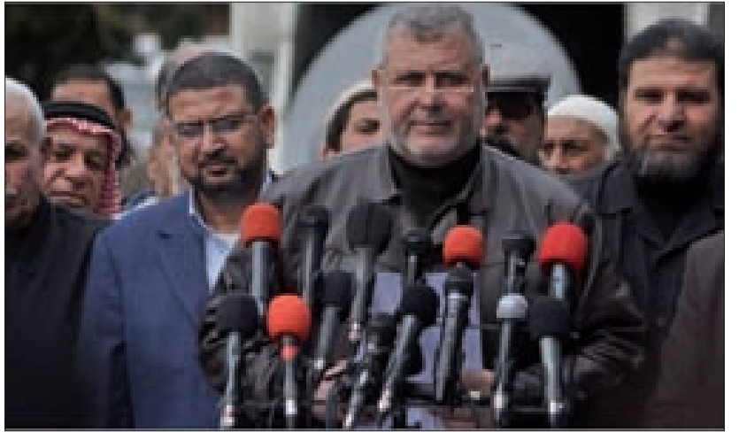
وقد حماس - الجهاد الإسلامي

أكد الناطق باسم حركة حماس سامي أبو زهري أن رئيس حكومة الاحتلال بنيامين نتانياهو «فشل 100 في المئة في عدوانه على قطاع غزة». وقال أبو زهري في بيان صحفي أمس: «لا زال في وسعنا الكثير لنفعله ونتنايهو وفشل في غزة تماما».