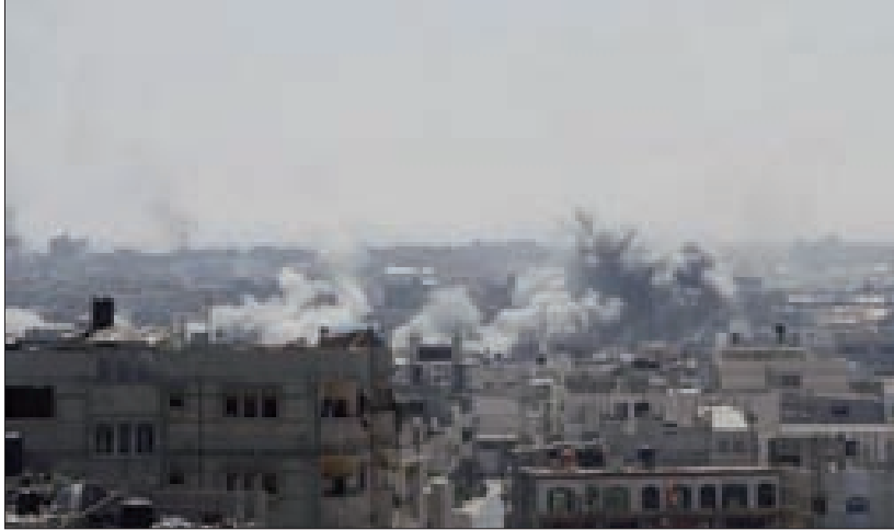
العدو يقصف مواقع مدينة أمّنة

التي استمرت 30 يوماً، وأن العالم أجمع شاهد هشاشة هذا الكيان المستبد والقاتل. ووصف الانسحاب القسري لقوات الاحتلال الصهيوني من غزة، بأنها هزيمة ثالثة مذلة لهذا الكيان المزيف، وقال: إن النزعة الخبيثة للصهيانية قد امتزجت بالعدوان والقتل، لذلك لا يوجد ادنى أمل بالمسيرة السلمية وبناء الديمقراطية وفق رأي الأغلبية أصحاب الأرض الأصليين في فلسطين المحتلة.