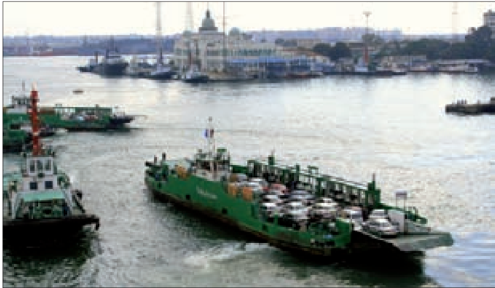
محاولات لانتشال الاقتصاد المصري

أعلن الرئيس المصري عبد الفتاح السيسي أمس عن تدشين مشروع محور قناة السويس.