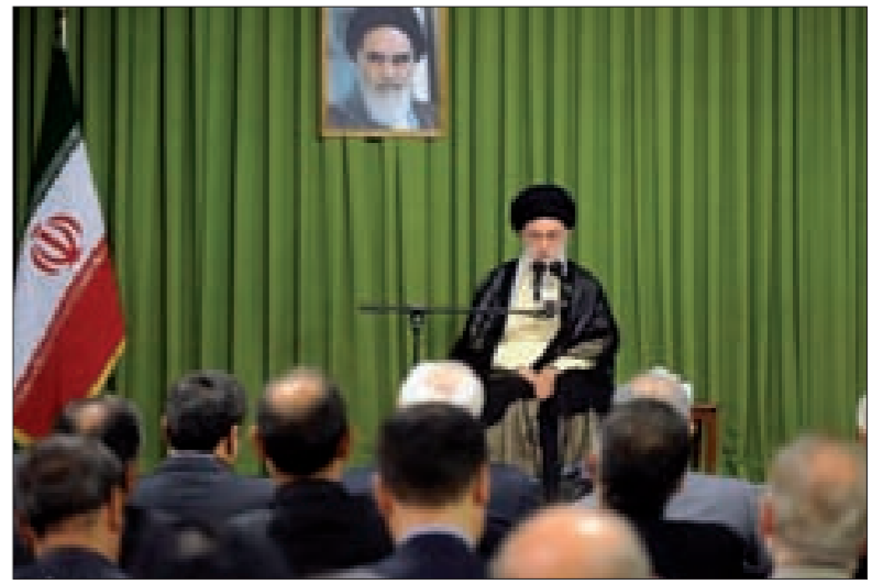
خامنئي خلال استقباله رؤساء البعثات الدبلوماسية الإيرانية