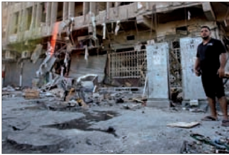
التفجيرات تلاحق العراقيين