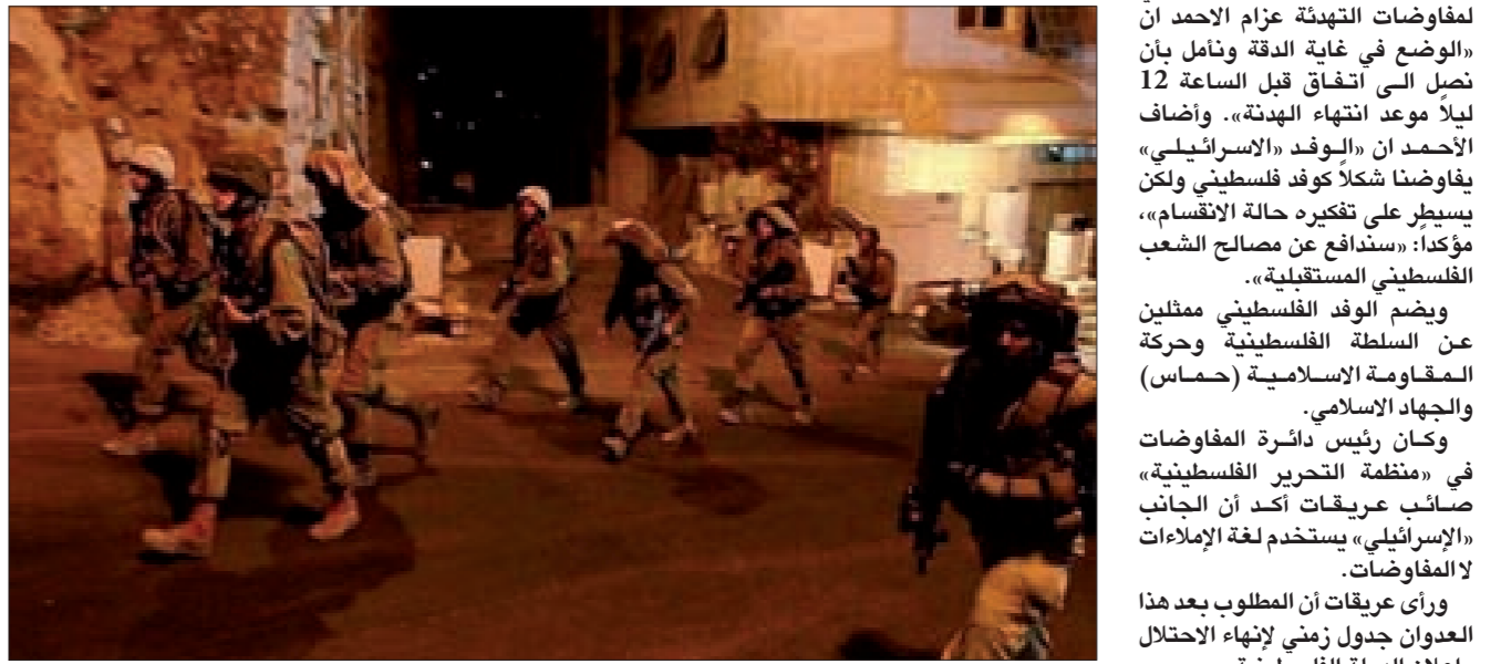
قوات الاحتلال تقوم بمداهمات واعتقال المقاومين