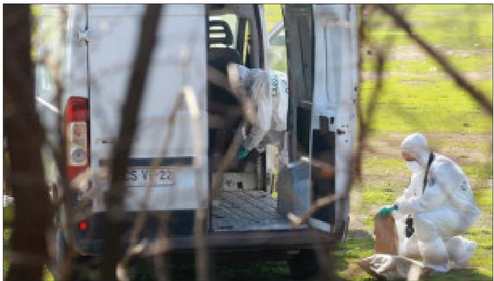
مطار تشيلي الدولي

تجمع آلاف المحتجين في مدينة لاهور بشرق باكستان أمس، استعداداً للتوجه إلى العاصمة إسلام آباد للتظاهر هناك ضد الحكومة. يأتي ذلك بعد أن أصدرت المحكمة في اللحظة الأخيرة قراراً بالتريخيص للتظاهرة السلمية وتعهدت الحكومة الالتزام به. وابتدت الأجواء الاحتفالية في مدينة لاهور عند منزل عمران خان لاعب الكريكت، الذي تحول