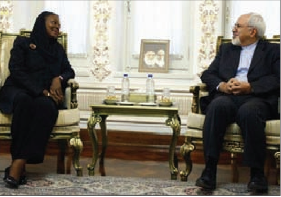
ظريف مستقبلاً المنسقة الأممية

الثانية باعتبارها نائبة الأمين العام للأمم المتحدة للشؤون الإنسانية حيث زارت إيران في أيلول الماضي. ومن المقرر أن تلقي أموس في طهران وزير الخارجية محمد جواد ظريف ومساعده عباس عراقجي وحسين أمير عبدليهان. كما ستلقي إسماعيل نجار رئيس مؤسسة إدارة الكوارث الطبيعية ومحمد فرهادي رئيس جمعية الهلال الأحمر الإيرانية.