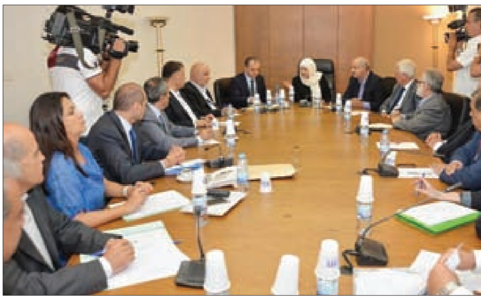
لجنة التربية مجتمعاً في المجلس برئاسة الحريري وحضور بو صعب

وعقدت هيئة التسويق النقابية اجتماعاً مطولاً في مقر رابطة التعليم الثانوي في وزارة التربية، وأعلنت بعد أن «قرار مقاطعة التصحيح جاء بناء على طلب وزير التربية والتعليم العالي الياس بو صعب الذي يتحمل مسؤولية تقديم الإفادات إلى الطلاب بتغطية من الحكومة»، وتوجّهت إلى السياسيين بالقول: «تختلفون في السياسة وتتفقون على ضرب حقوقنا وضرب الشهادة الرسمية.» وتهدّدت الهيئة بأنّها «لن نألو جهداً ولن نتوانى عن إنقاذ الشهادة، وبأنّ معركتها ستبقى مستمرة ومفتوحة بوجهه السياسييين، وستعمل على الارتقاء بأدائها»، وأعلنت الإضراب الشامل في جميع الوزارات والإدارات العامة يوم غد الخميس، مع الاعتصام عند الساعة الـ 11 أمام وزارة الاقتصاد - قال بو صعب: «كلنا مع التصحيح، وبنينا على الارتقاء بأدائها»، وأكدت أنّها «بصدد وضع خطة تحرك للمرحلة المقبلة»، وأوضحت أنّ «العام الدراسي 2015/2014 سيكون طبيعياً واعتباراً من 2014/9/1». وتوجّهت الهيئة إلى الأهالي والطلاب بالقول: «في الوقت الذي كانت مجالس المدنيين تناقش ملف الحقوق وإنقاذ الشهادة الرسمية، ورفض الإفادات وكل الخيارات المطروحة أمامها بإعطاء نسبة زيادة واحدة للجميع، جاءت قرارات لجنة التربية لسدّ الخيارات والأبواب أمام هيئة التسويق النقابية في إنقاذ الشهادة الرسمية. ومن يتحمل مسؤولية إعطاء الإفادات هو وزير التربية والحكومة مجتمعاً التي قدمت له التغطية السياسية.»