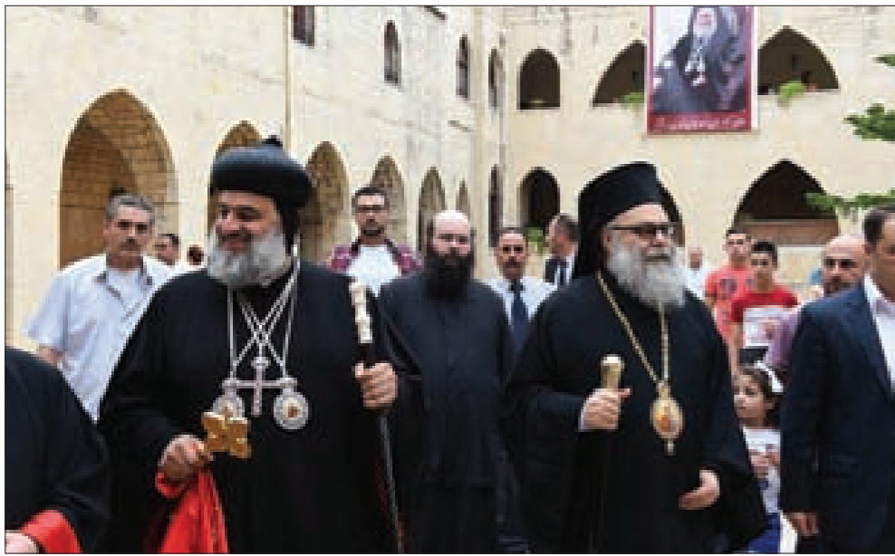
يازجي مستقبلاً افرام الثاني

الحقّ إلى مأساة فلسطين. وانظروا إلى لبنان الذي يدفع ضريبة غالية، عرفنا في هذه الأرض مبنياً لأجداد الحرف والحرف صورة الحاجة إلى لقب الآخر. ولم نعرفها مرتعاً للتكفير والإرهاب والخطف المتقلّب. وقال يازجي: «نحن في هذا المشرق سمعنا لغة التضامن والتمني لمن أنيطت بهم لغة القرار والتطبيق. شعبنا شعرات ومطراننا يوحنا وبولس وبكهنتنا وآناسنا يخطفون وسط فرج العالم.» ثم كانت كلمة للمطريرك افرام الثاني شدّد فيها على «أهمية إحلال السلام في كل المنطقة»، وشكر فيها المطريرك على هذه اللفتة التاريخية. وتحدث المحافظ البرازي عن «قيم التسامح الديني الذي عاشته وتعيشه سورية»، مشيداً بأهمية المصالحة التي تحققت في كثير من المناطق. ودعا إلى «المحافظة على تاريخ وحضارة سورية وقيم عيشها الواحد بين كل الأديان».