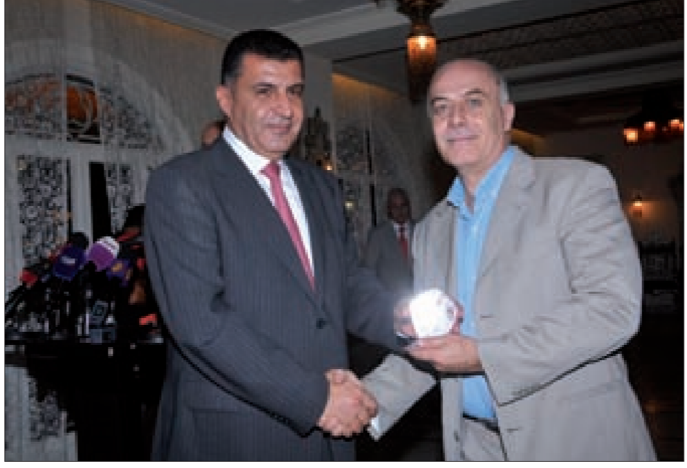
الدرع التقديرية لـ «البناء» (اكرم عبد الخالق)