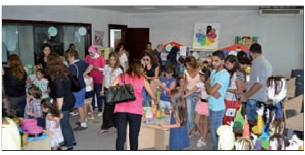
جولة في المعرض

دمى من خلال استعمال أكياس الورق، إضافة إلى إبداعات أخرى. وانطلاقاً من الترتيبات لمجموعات الأطفال في ورشة صناعة الكتاب، إذ اختاروا الفينيقين كموضوع للبحث، وتعريفهم بالأحرف الفينيقية، نتج عنها صناعة كتاب عن الفينيقين زين برسومات الأحرف الفينيقية كاملة، كما صنعوا المركب الفينيق. وتضمن الكتاب أيضاً معلومات قيمة عن الحضارة الفينيقية، والتي جمعها الأطفال الفينيقيين من خلال بحثهم وقراءتهم. وعبر الأهل عن سعادتهم بالعامرة بالأعمال التي قام بها أطفالهم والتغيير الواضح في ردود فعلهم وتصرفاتهم، خصوصاً البعض منهم الذين كانت شخصيتهم انطوائية إلى حد ما، كما أعجب الأهل بالنتائج المذهلة التي حققتها ورشة صناعة الدمى، من خلال أعمال أيديهم التي كانت لها حصة كبيرة من المعرض، وشكروا مكتبة المني ومؤسسة الصفدي على هذا النشاط الذي صاروا ينتظرونه وأطفالهم كل سنة.