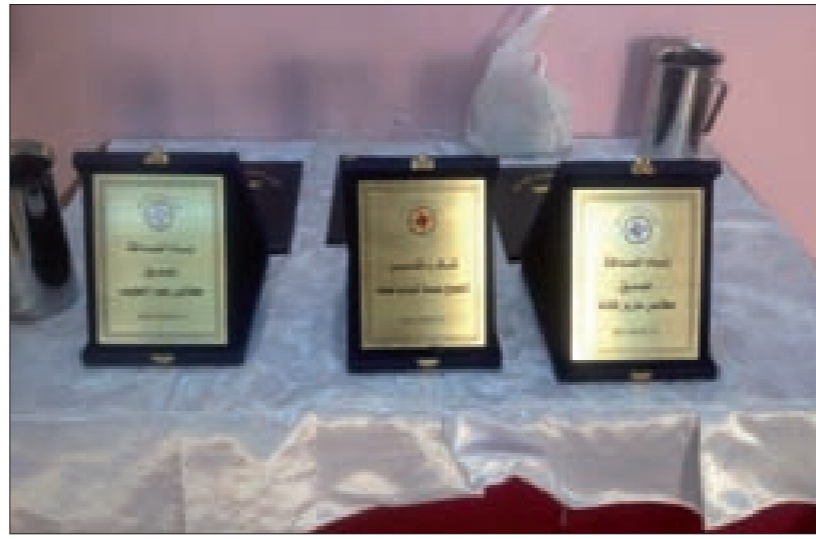
عدد من الأوسمة وشهادات التقدير