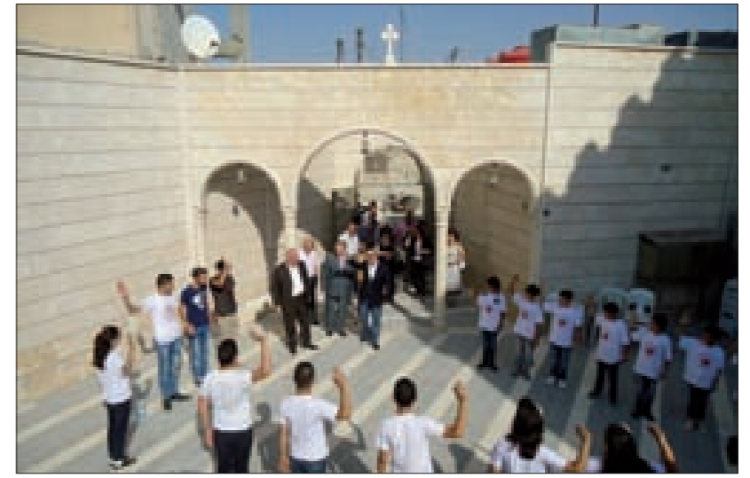
عدد من الأوسمة وشهادات التقدير