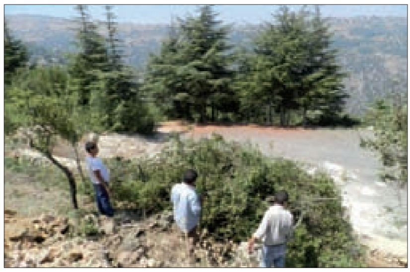
الأشغال في حديقة البطارقة