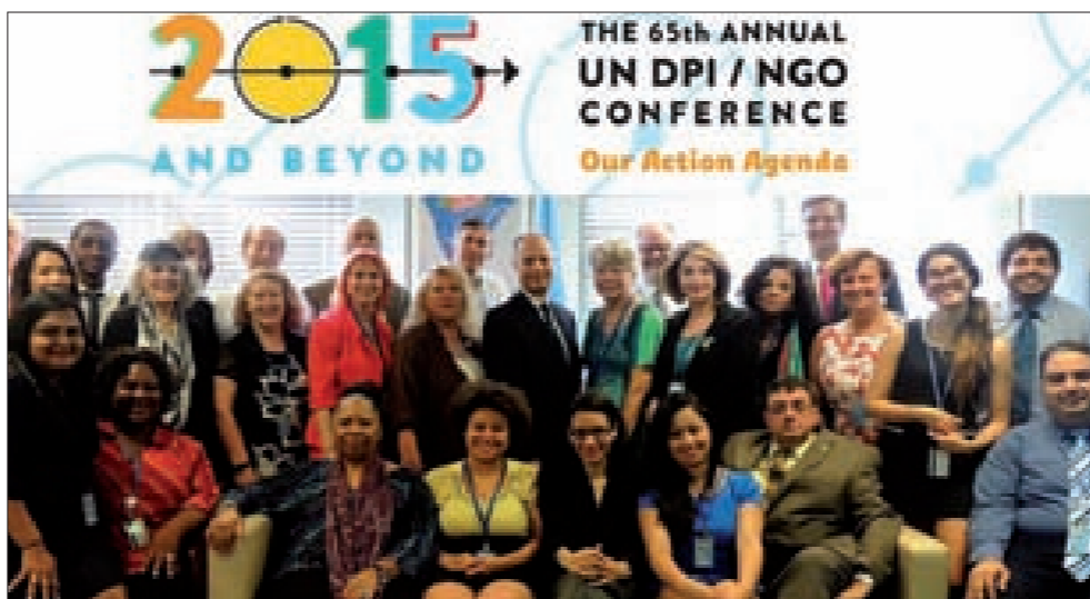
المشاركون في المؤتمر

بمشاركة ممثلين عن 117 بلداً، وبحضور 900 منظمة غير حكومية، اختتمت في مقر الأمم المتحدة في نيويورك، مؤتمر المنظمات غير الحكومية الـ 65 برعاية إدارة شؤون الإعلام في الأمم المتحدة، والذي استمر لمدة ثلاثة أيام.