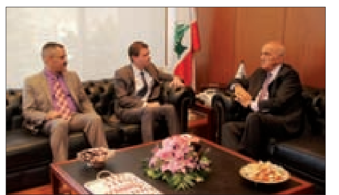
مقبل وهل في البرزة

بحث نائب رئيس مجلس الوزراء وزير الدفاع الوطني سمير مقبل في مكتبته في البرزة أمس، مع السفير الأميركي ديفيد هل برفقة الملحق العسكري الكولونيل أنطونيو بانتش والمستشارة كاتيلان، موضوع تسليم الجيش وتزويده بالآليات والأسلحة المتفق عليها مع القيادة العسكرية والتي تمكنه من القيام بمهامه الكاملة.