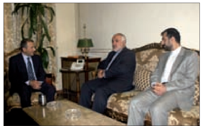
باسيل وفتحلي في الخارجية

جلس وزير الخارجية والمغتربين جبران باسيل أمس، دعوة إلى المشاركة في تلمعة مجلس الأمن الذي ستنعقد غدا الجمعة حول «داعش» والإرهاب والتي يشترك فيها رؤساء وفود الدول المشاركة في اجتماعات الجمعية العمومية للأمم المتحدة.