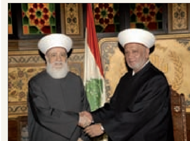
مصافحة بين السلف والخلف (تموز)