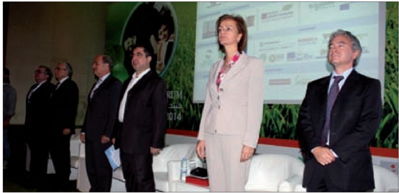
خالد افتتح المنتدى

أعلن وزير الصناعة حسين الحاج حسن أنه «لا يمكن لوزارة المال أن توفر المال أكثر لمؤسسة كهرباء لبنان ولا يمكن المؤسسة أيضاً أن ترفع سعر الكهرباء»، لافتاً إلى «الحاجة لحسم قرارنا السياسي، وبتبني سياسات اقتصادية وكهربائية ونعطي الفترة الزمنية المطلوبة لتنفيذ الخطط والبرامج»، معتبراً أن «الطاقة البديلة ليست الحل الشامل للمصانع». كلام الحاج حسن جاء خلال افتتاح وزير الطاقة والمياه آرثور نظريان، «منتدى بيروت الخامس للطاقة: الطاقات المتجددة وكفاءة الطاقة»، الذي ينظمه المركز اللبناني لحفظ الطاقة بالتعاون والتنسيق مع وزارة الصناعة والطاقة والمياه وبرنامج الأمم المتحدة الإقليمي وجامعة الدول العربية والاتحاد الأوروبي والمركز الإقليمي للطاقة المتجددة وكفاءة الطاقة، في فندق «لورويال» - ضبيه.