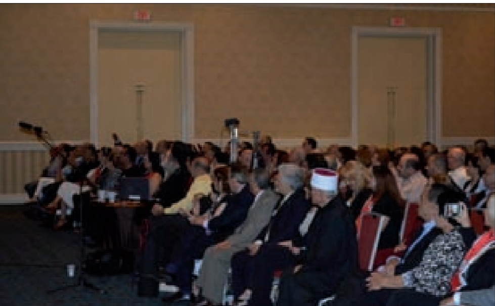
من حفل لجنة العرب الأميركية للدفاع عن سورية

قدمت للحفل إعلامية فاطمة عطية، وقرأت آ. عبير الزويدي قصيدة بدعوتكم لي لانها انت من حزب رفق راية الوحدة ودافع عنها وبذل في سبيلها التضحيات، وأنا اعتقد، وأظن بانكم تشاطرونني الاعتقاد، بأن من حكم بالإعدام على سعادته هو نفسه من يسعى إلى تدمير سورية وتدمير العالم العربي من المحيط إلى الخليج». وأضاف: إن الذين قتلوا أنطون سعادة، هذا المعلم وهذا المعفر وهذه الشخصية الوجودية السورية المتمتزة، إنما أرادوا أن يقتلوا هذه النهضة التي جاء بها. إن إعدام سعادته وصمة عار في جبين الإنسانية، إنه إعدام رجل آزاد الحرية والوحدة لأتمته، ودافع عنها وعن موهبتها فكان عقابه الموت، إنما موت سعادته هو حياة، إنه مات في