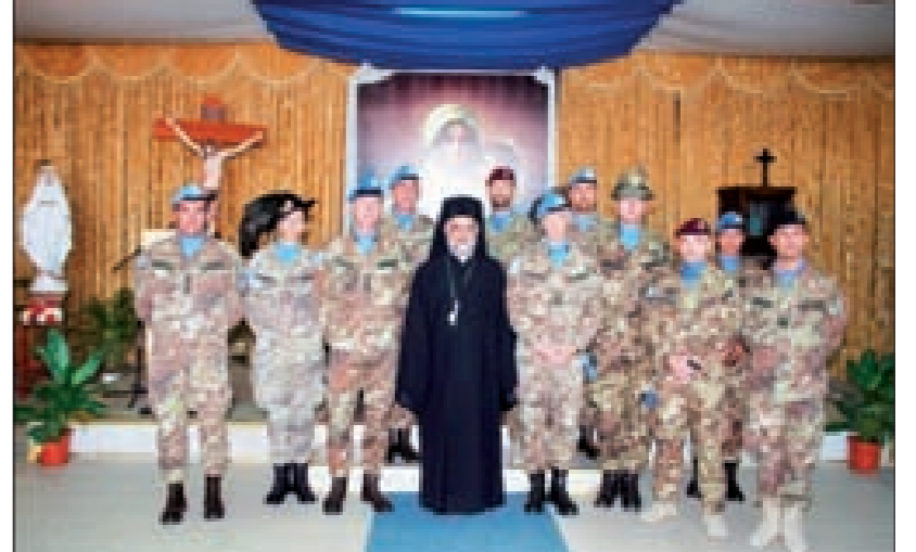
المطران الأبرص خلال زيارته الوحدة الإيطالية في شمع

وخلال زيارته، ترأس المطران الأبرص قداس الأحد، بحضور بوللي وعدد كبير من الجند الإيطاليين.