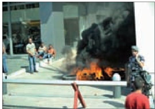
من اغتصام المياومين أمس (تصوّز)

وتردي الخدمة للمواطنين. إن الشركة ستواصل التنسيق مع مؤسسة كهرياء لبنان من أجل استمرار تأمين إصلاح الأعطال الطارئة للمواطنين بقدر المستطاع».