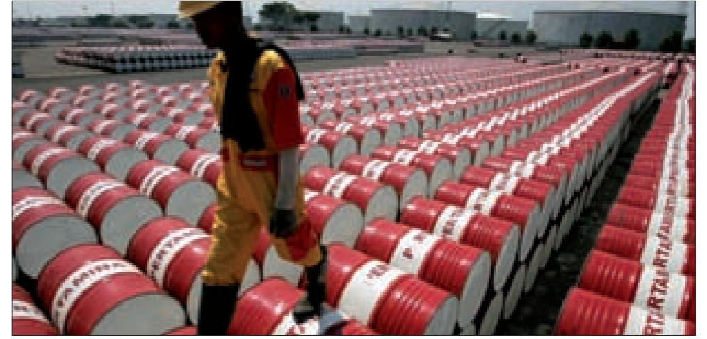
لا خطر على المدى البعيد طالما اقتصرت العمليات على الضربات الجوية