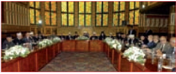
القمة الروحية: التأخير في انتخاب الرئيس يعطل دور لبنان