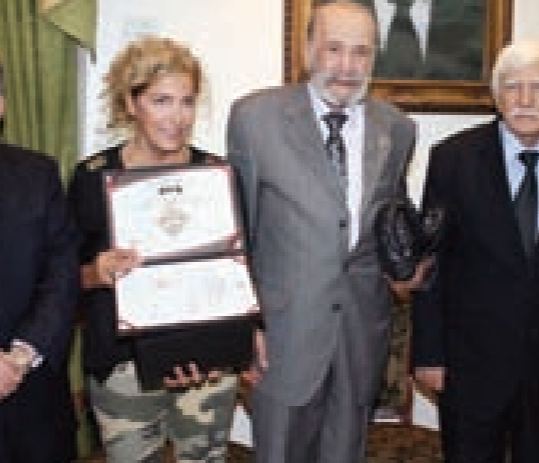
سبيعي وابنته يتوسلان قانسو والأحمد