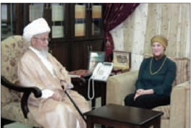
النبلسي مستقبلاً ترايسي شمعون

الخطيرة في كل من سورية والعراق وليبيا واليمن. ولكن من الممكن جداً أنّ تقرب ساعة الحقيقة فيصبح لبنان يفعل السياسات الخاطئة ويفعل نيات التكفيريين ساحة واسعة لهستيرياً فتأوى الذبح». وشدّد النبلسي على «أنّه من غير الممكن استمرار الوضع على هذا المنوال فأما المسارعة إلى الوحدة الحقيقية والتضامن من أجل حماية لبنان بمسلميه ومسيحييه وأما فعلى الوطن السلام.»