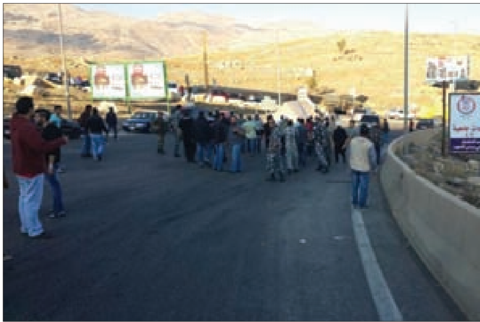
قوى الأمن تتدخل لفض إشكال في ضهر الجبدر

استقبل رئيس منتدى الحوار الوطني فؤاد مخزومي، بحساسة أكثر فاكتر جيال الغرب»، لافتاً إلى أنّ «التحالف الدولي ضدّ الإرهاب على أهميته لردع التطرف، ليس كافياً. إذ يجب أن يوازيه التعاطي مع الشباب المسلم بذهنية الانفتاح والاحترام، خصوصاً أنّ هذا الشباب الذي ولد وترعرع في الغرب برهن أنّ التكفير في المواطنة هو الدافع الرئيسي للاتحاق بالتطرف والمنظمات الإرهابية في سورية وإفريقيا». وأضاف: «إنّ الشباب العربي يلجح إلى التغيير ويريد الحرية والديمقراطية في بلده، في ظل أنظمة هتة تحكمها الاعدالة الاجتماعية والاستبداد».