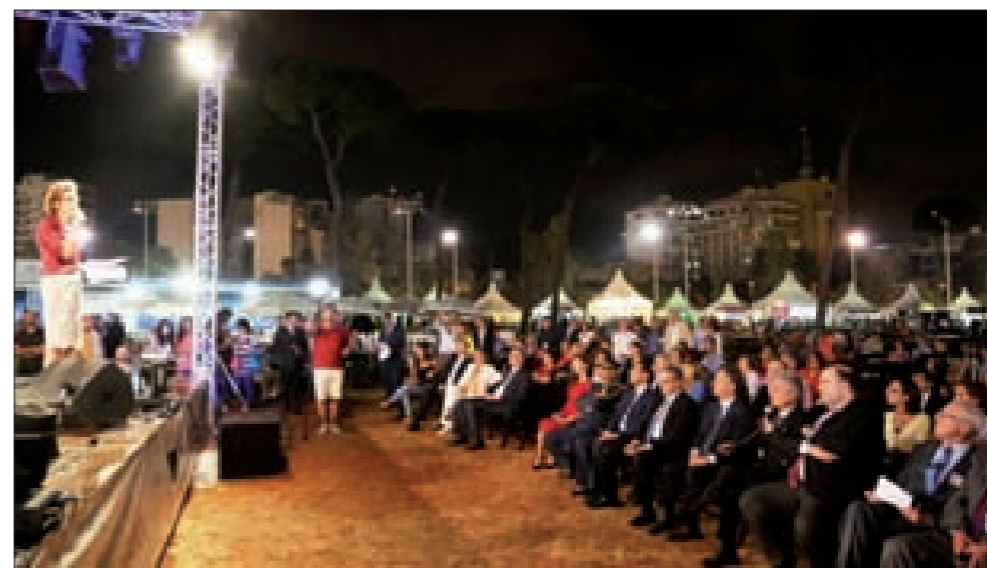
خلال افتتاح معرض النبيذ

أشار وزير السياحة ميشال فرعون إلى ضرورة «تحسين كل القطاعات الإنتاجية»، لافتاً إلى «أننا نلتزم بالخطة الخمسية في الحكومة، ونحن متفوقون على الاستقرار الأمني، مضيفاً أنه «علينا تحسين الاستقرار السياسي من خلال انتخاب رئيس جديد للجمهورية اللبنانية».