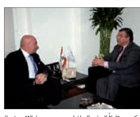
حكيم مستقبلاً السفير البرازيلي

وقّعت روسيا والصين أمس، على هامش زيارة رئيس مجلس الدولة الصيني لي كه تشيانغ إلى موسكو، على مجموعة من الاتفاقات في مجال الطاقة والمصارف ومجالات أخرى. وأشار رئيس الوزراء الروسي دميتري مدفيديف بعد توقيع 38 اتفاقاً إلى «أهمية فتح آفاقاً جديدة رغم الوضع الصعب». هذا وتعدّ هذه الاتفاقات أول الدلائل الملموسة على أن قرار روسيا في التوجه بصورة أكبر إلى آسيا، بدأ يؤتي ثماره منذ التوصل إلى اتفاق توريد الغاز أثناء زيارة الرئيس بوتين لشنغهاي في أيار الماضي. ومن أبرز هذه الاتفاقات، اتفاق يتعلق بتوريد الغاز الروسي عبر «المسار الشرقي» إلى الصين وينص على تقديم الدعم الكامل للشركات المعنية في تطوير البنية التحتية لنقل الغاز، وإقامتها وتشغيلها، وهو اتفاق ضروري للضخ في تنفيذ اتفاق توريد الغاز لمدة 30 عاماً بقيمة 400 مليار دولار الذي جرى توقيعه بين الطرفين في أيار الماضي. أما في ما يتعلق به «المسار الغربي»، فأشار مدفيديف في ختام لقاء عقده مع رئيس مجلس الدولة الصيني، إلى أنه «يوسع موسكو وبكين الاتفاق العام المفضل على توريد الغاز الروسي إلى الصين عبر «المسار الغربي» أيضاً». وأعلن رئيس شركة «غازبروم» ألكسي ميلر من جهته، أن عقد «توريد